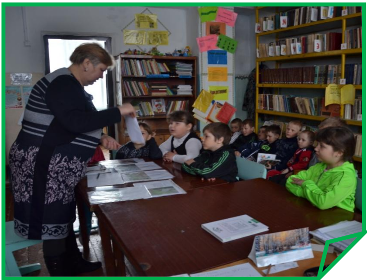
Литературная гостиная, конкурсы стихов