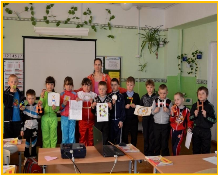
Разработка и защита проектов