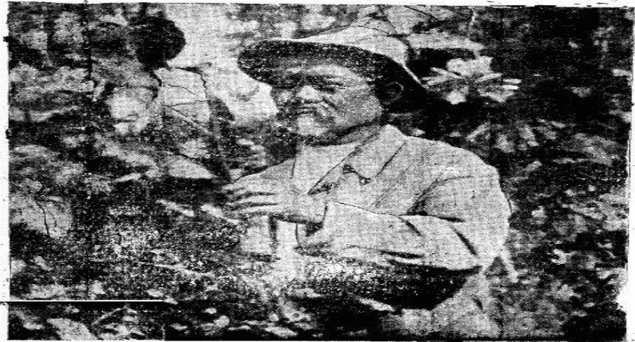
В ВИНГРАДИНАХ. Будущий столица Союзной республики — Алма-Ата, утопающая в ибленевых садах, сейчас окружается кольцом виноградников. Благодаря алма-атинскому виноградарству уже имеет своих энтузиастов, своих патриотов. Так же колхозный садик Хаммамберди Бухажиева, созданный в честь имени Калинина виноградник Фото В. Агафеева.