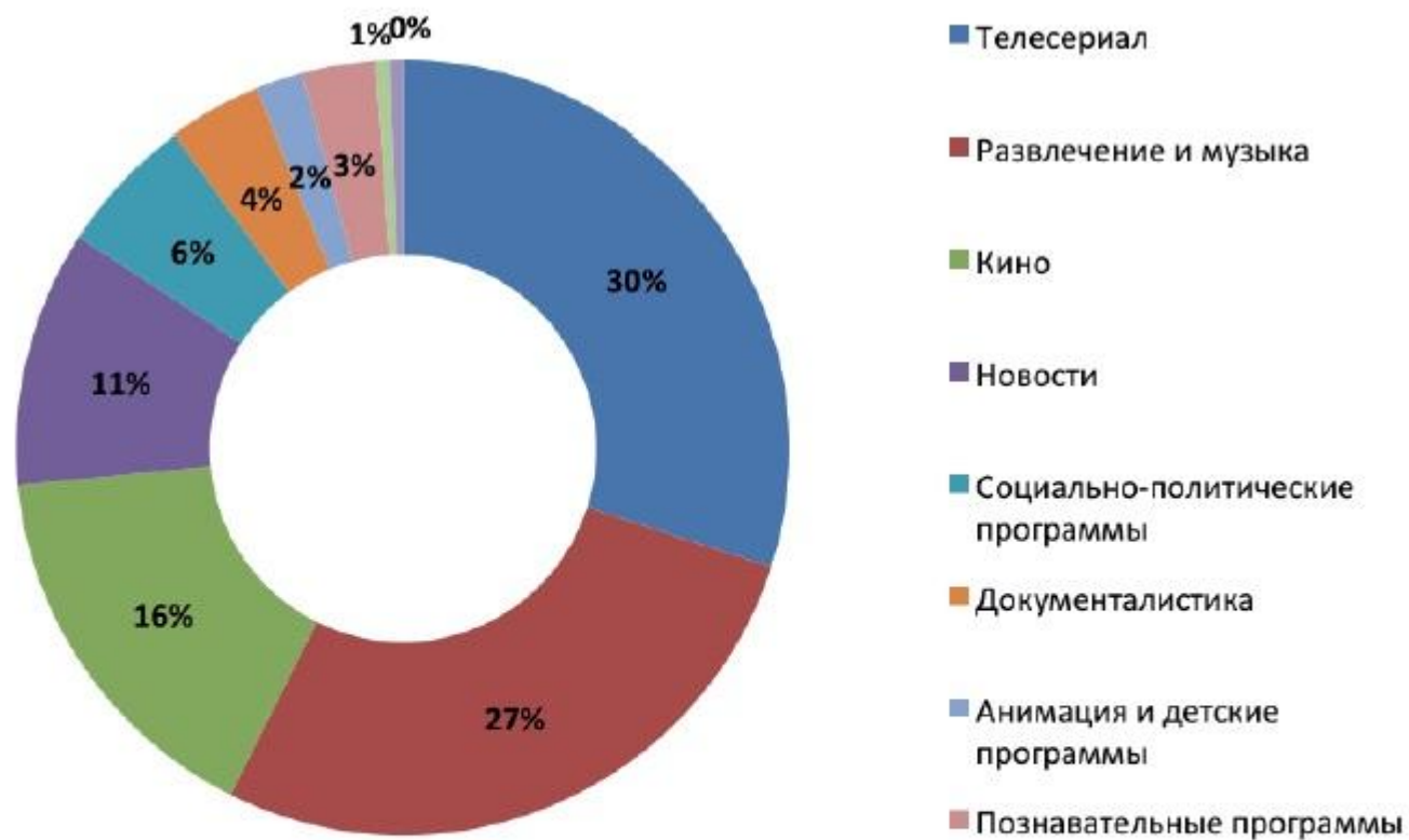
Рисунок 28. Доля различных жанров в телепотреблении, % от совокупного объема телепросмотра