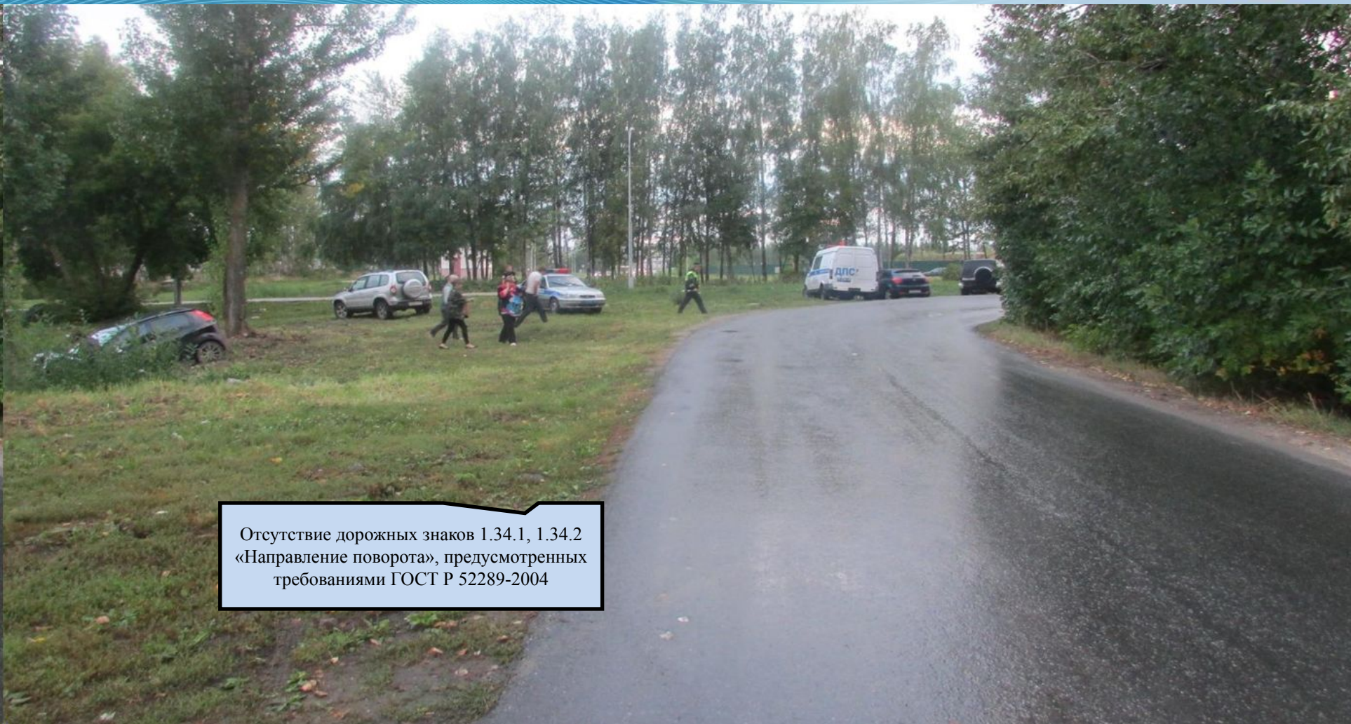
Отсутствие дорожных знаков 1.34.1, 1.34.2 «Направление поворота», предусмотренных требованиями ГОСТ Р 52289-2004