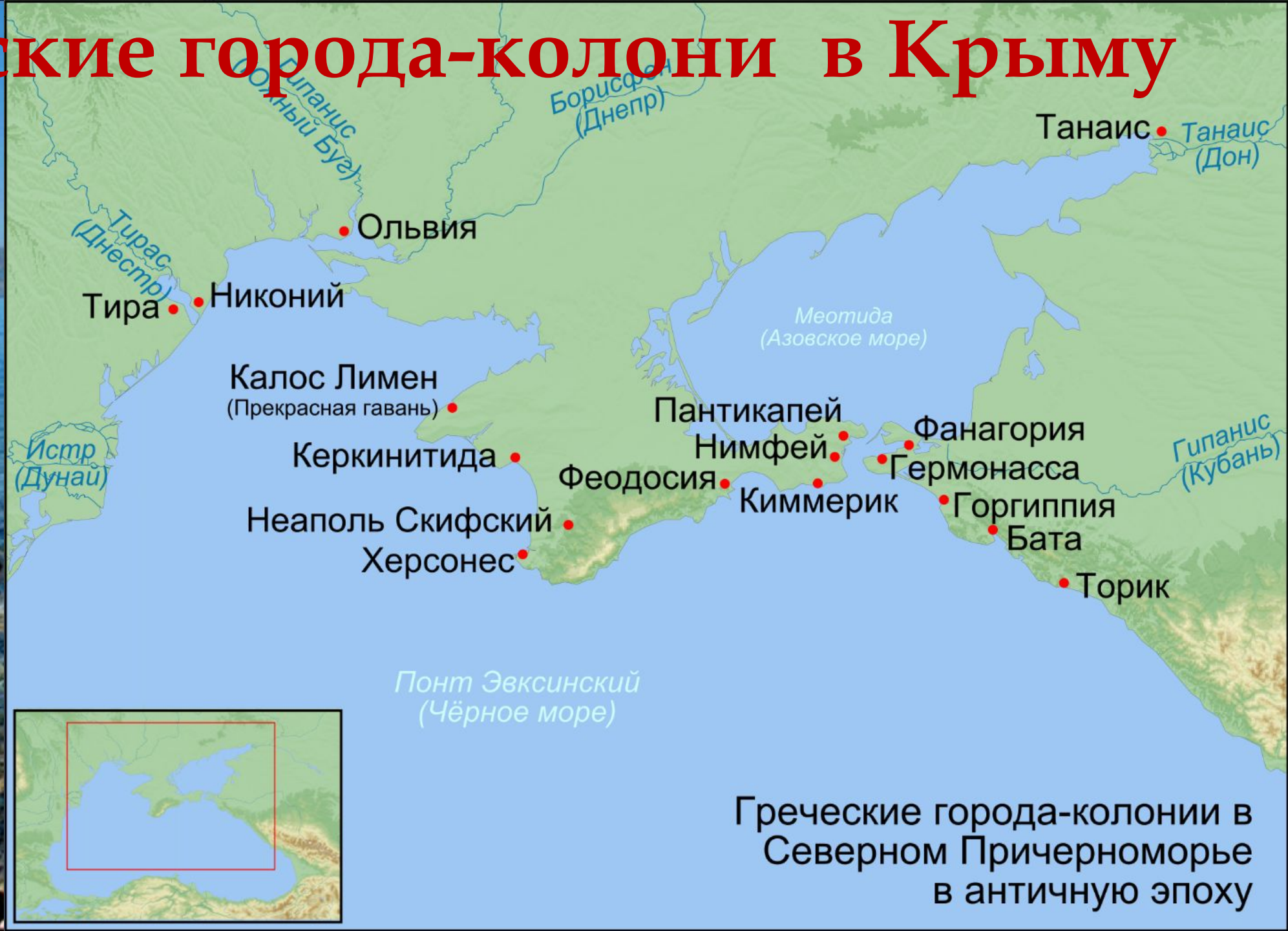
Греческие города-колонии в Северном Причерноморье в античную эпоху