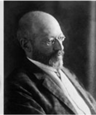
В. Вундт Г. Зиммель