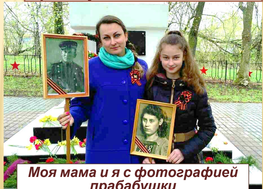
Моя мама и я с фотографией прабабушки 9 мая 2017 года.