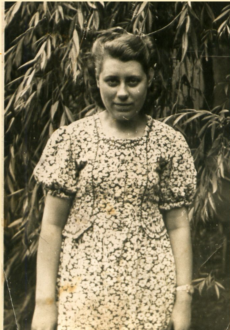
Моей прабабушке – 18 лет