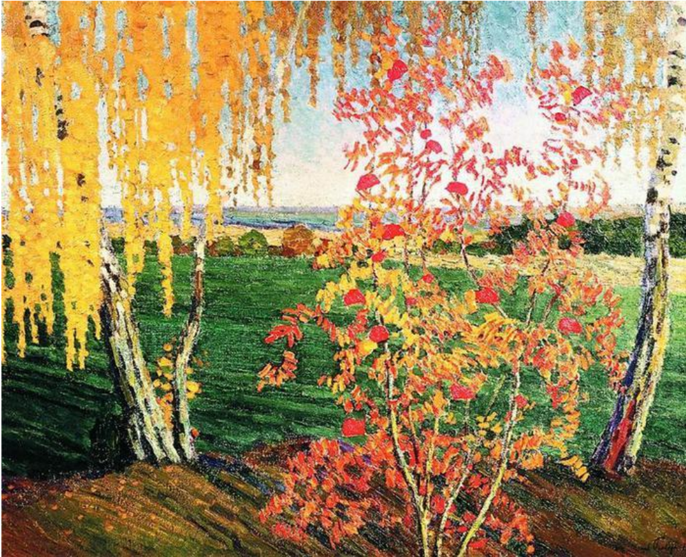
Игорь Эммануилович Грабарь.Рябинка [1915]