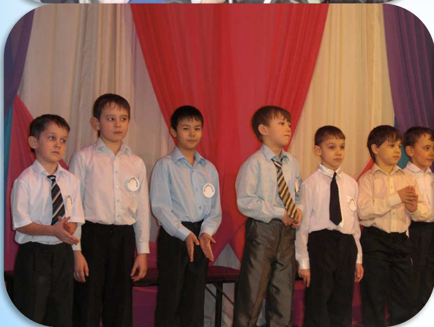
Конкурс рисунков, посвященный 23 февраля