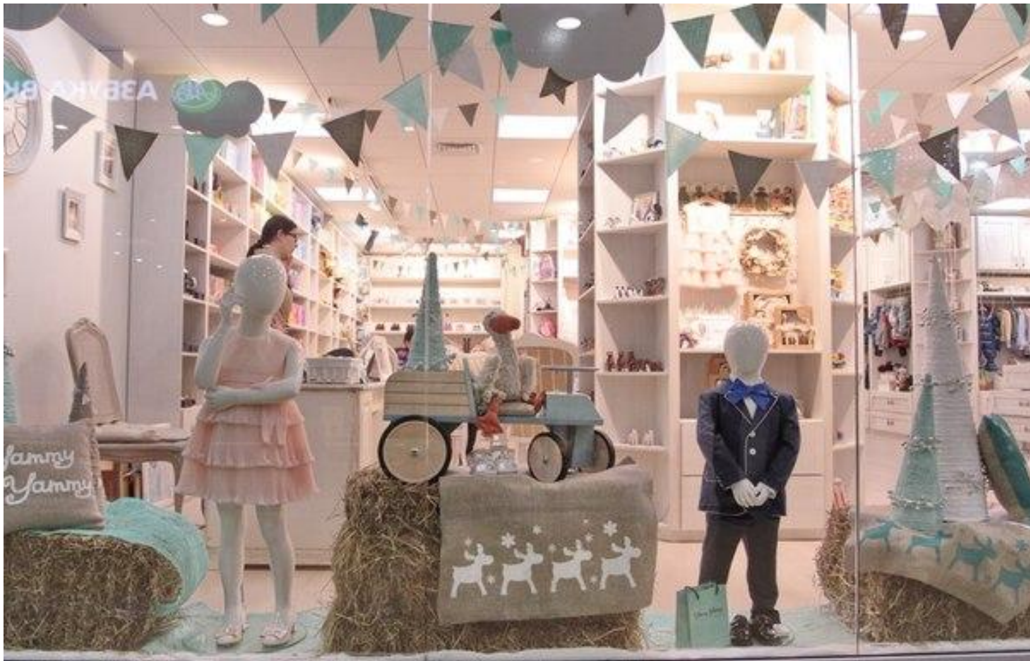
• Магазин детской одежды