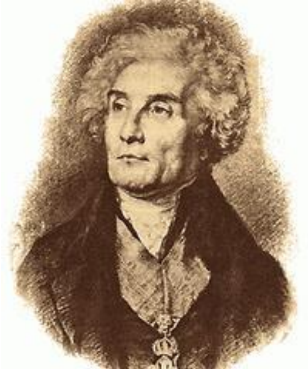
Жозефа де Местра