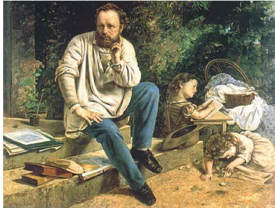
Пьер – Жозеф Прудон