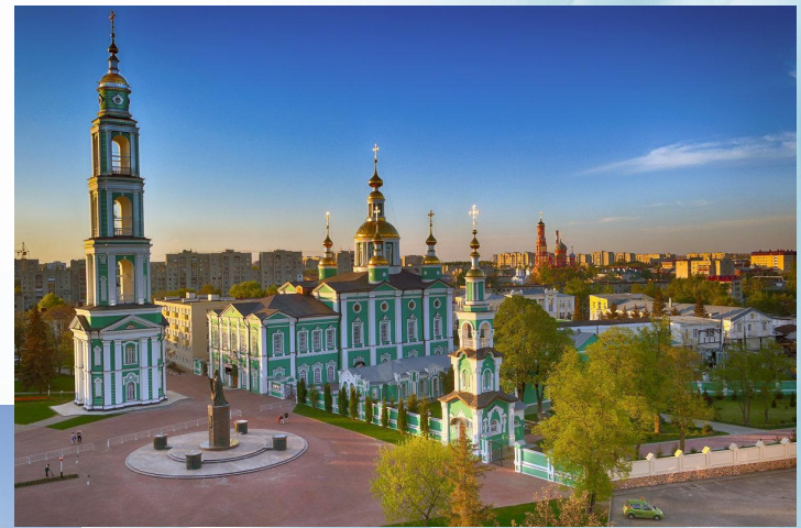
Спасо-Преображенский Кафедральный собор