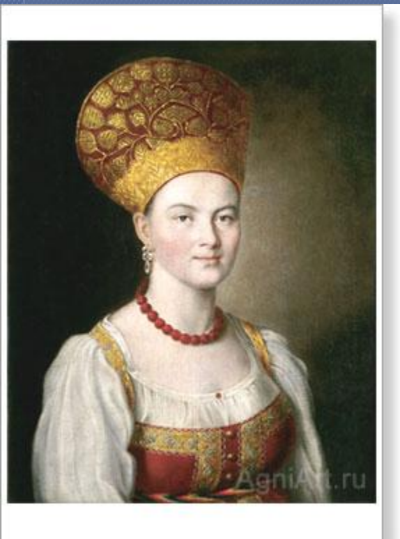
Аргунов «Портрет неизвестной в русском костюме».