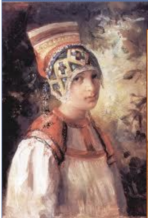
В.Е. Маковский «Крестьянка»