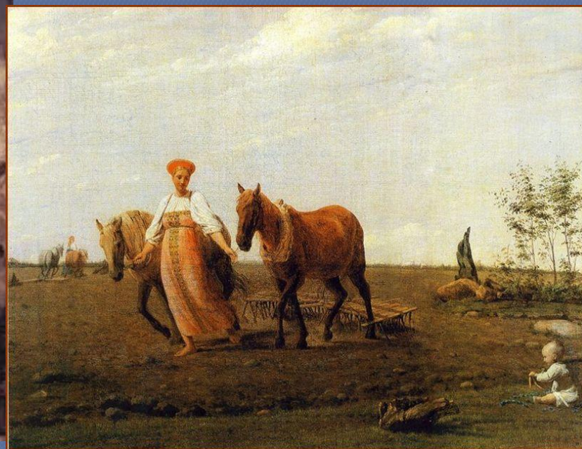
А.Г. Венецианов «На пашне. Весна».