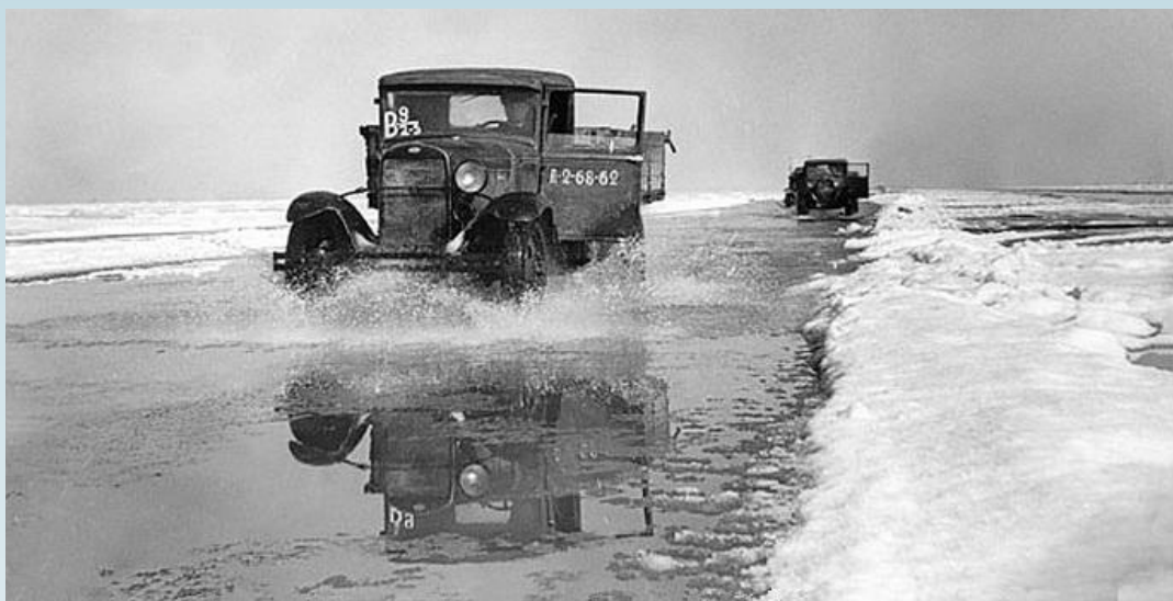
Дорога жизни по льду Ладожского озера