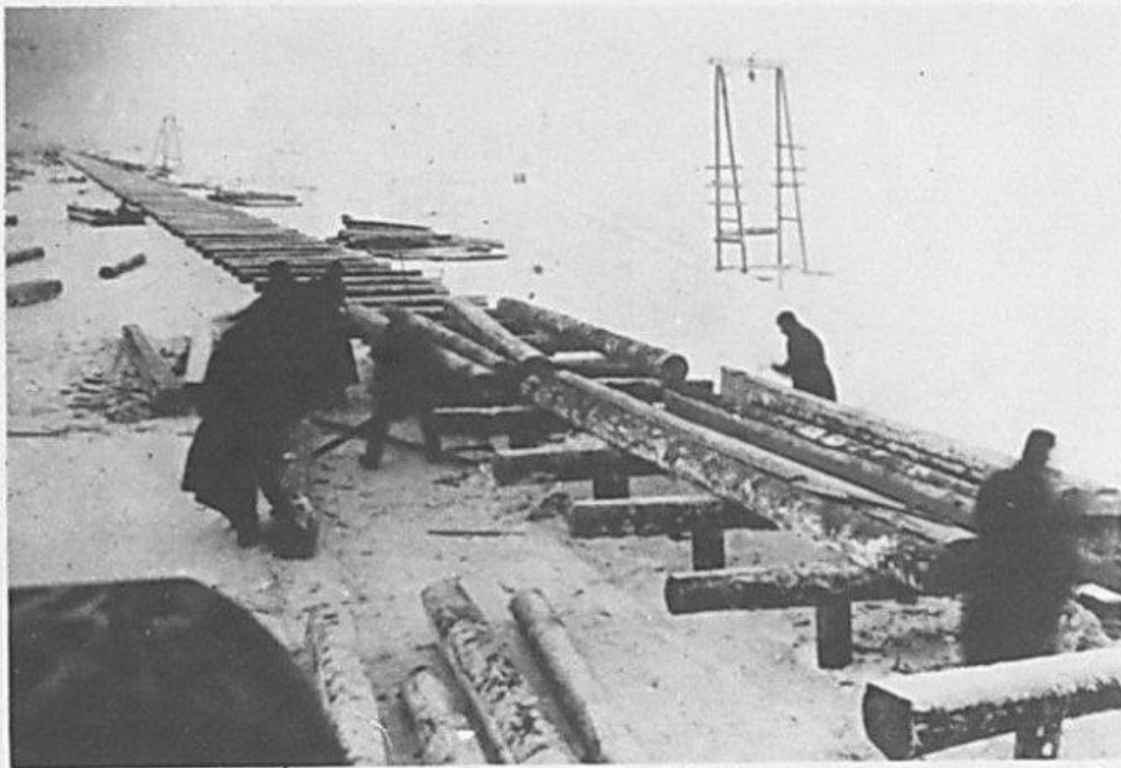
УКЛАДКА ПРОГОНОВ НА УЧАСТКЕ 40-го Ж. Д. БАТАЛЬОНА.

Дорога, построенная за 17 дней. Ее длина – 35 км!