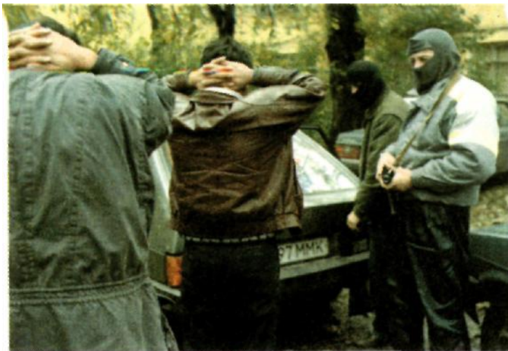
Задержание грабителей сотрудниками милиции.