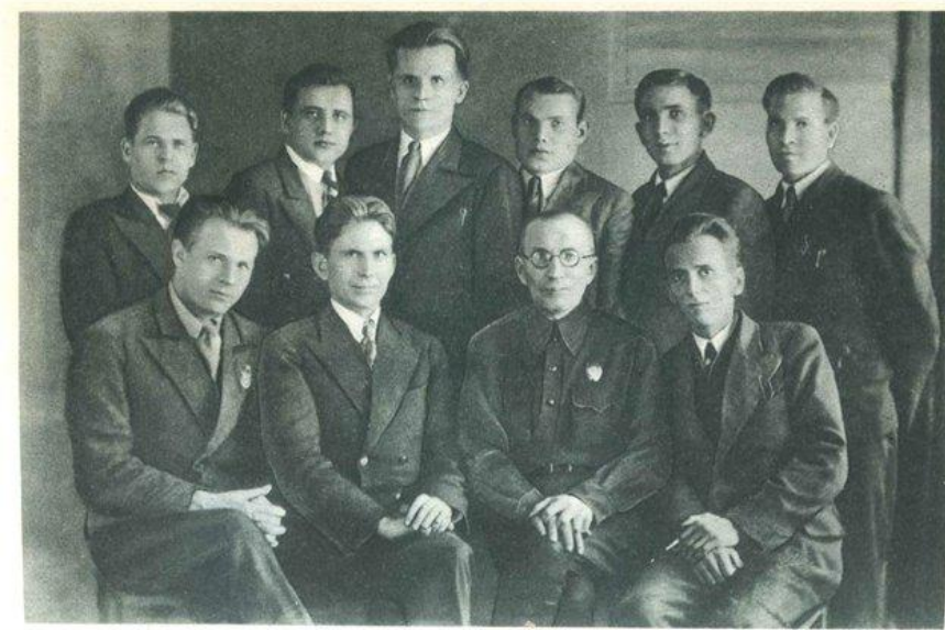
30. А. С. Макаренко с группой коммунаров, окончивших Харьковский юридический институт, 1939 г.