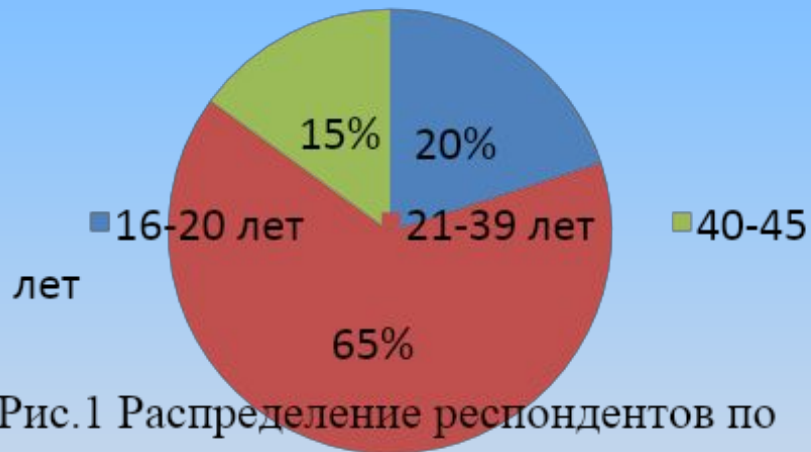
Рис.1 Распределение респондентов по возрасту

Процентный и количественный состав респондентов по возрастам