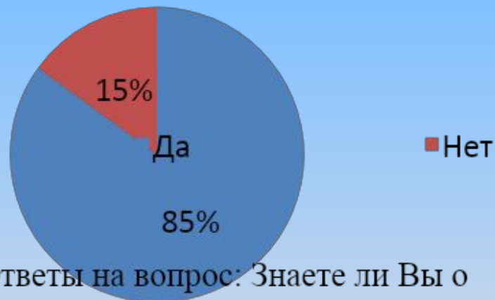
Рис.2 Ответы на вопрос: Знаете ли Вы о современных методах контрацепции?

Из данной диаграммы, известно что 15% признается в недостатке знаний.