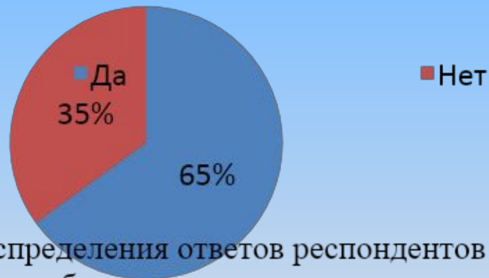
Рис.4 Распределения ответов респондентов об равенстве выбора контрацепции от

Большинство респондентов считают что от нежелательной беременности должны заботиться оба партнера, 35% считают что именно один из партнеров должен решить этот вопрос.