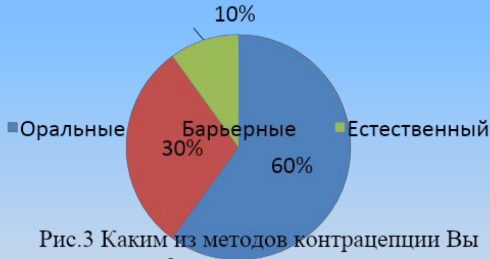
Рис.3 Каким из методов контрацепции Вы используете?

Самый распространенный способ контрацепции это оральные контрацептивы его используют 60% опрошенных, барьерным методом пользуются 30%, 10% считают, что защититься можно естественным методом.