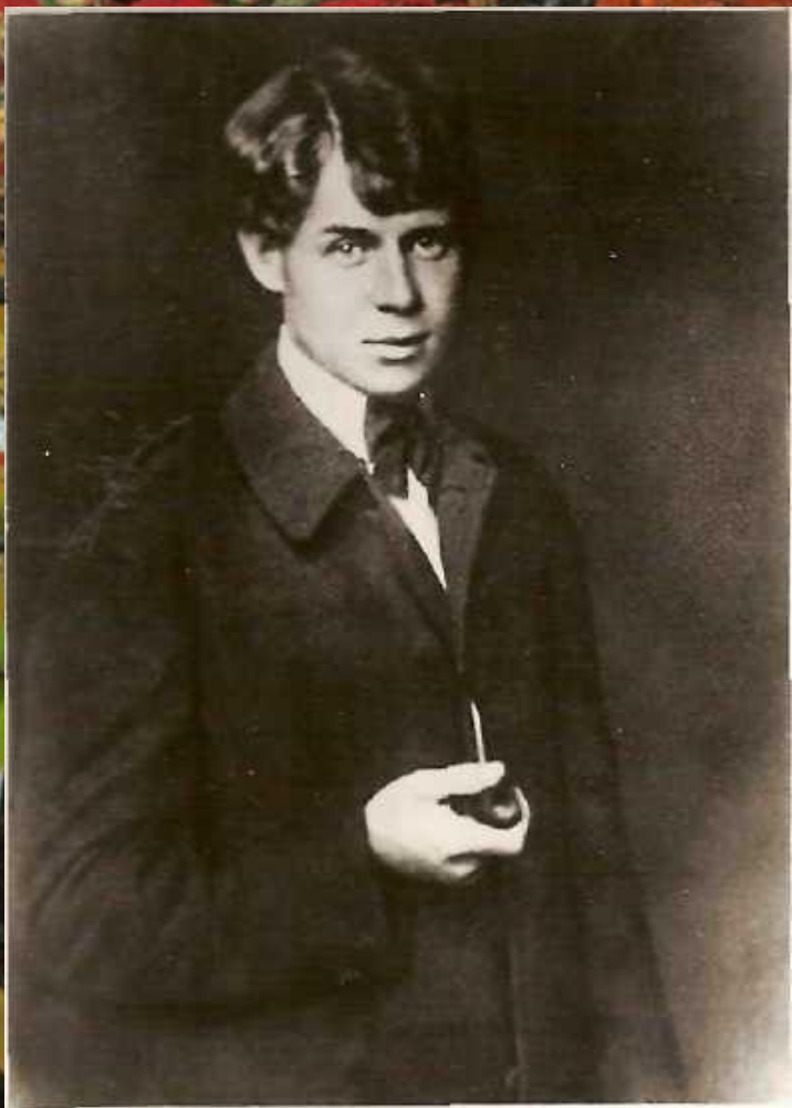
С. А. Есенин. Фотография

В ноябре 1925 года поэт закончил автобиографическую, исповедальную поэму «Черный человек», которая оказалась последней в ряду написанных им поэм, а среди них были такие значительные, как «Пугачев» (1921), «Страна негодяев» (1922-1923), «Песнь о великом походе» (1924), «Анна Снегина» (1925). Некоторое время Есенин находился в бакинской