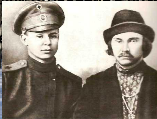
С. А. Есенин и Н. А. Клюев