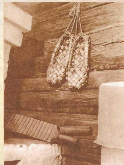
Интерьер дома- музея