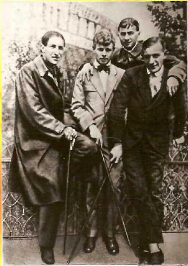
С. А. Есенин среди имажинистов.