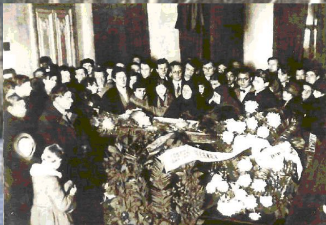
У гроба С. А. Есенина в Доме Печати.

Жизнь С.А. Есенина трагически оборвалась в Петрограде, в гостинице «Англетер» при невыясненных обстоятельствах. Поэта нашли повешенным. После гибели Есенина начался период официального забвения его творчества. В 1927 году появилась статья Бухарина «Злые заметки». Творчество поэта было признано мелкобуржуазным, кулацким, не соответствующим великой эпохе. Статья на много лет стала идеологической основой для