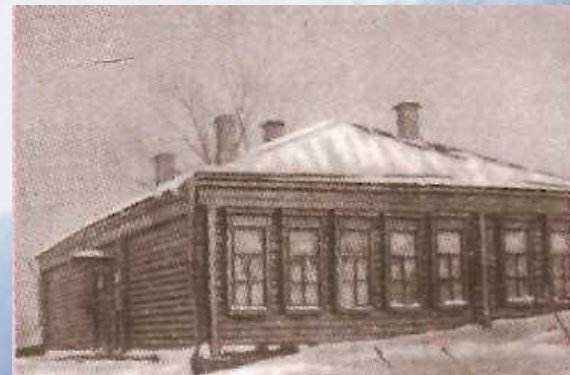
Константиновское земское училище

С 1904 по 1912 год учился в Константиновском земском училище и в Спас-Клепиковской школе. За это время им было написано более 30 стихотворений, составлен рукописный сборник «Больные думы» (1912), который он пытался опубликовать в Рязани. «Береза» - первое напечатанное стихотворение С. Есенина. С первых же стихов в поэзию Есенина входят темы родины и революции. Поэтический мир