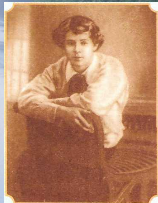
С.Есенин 1913—14 год