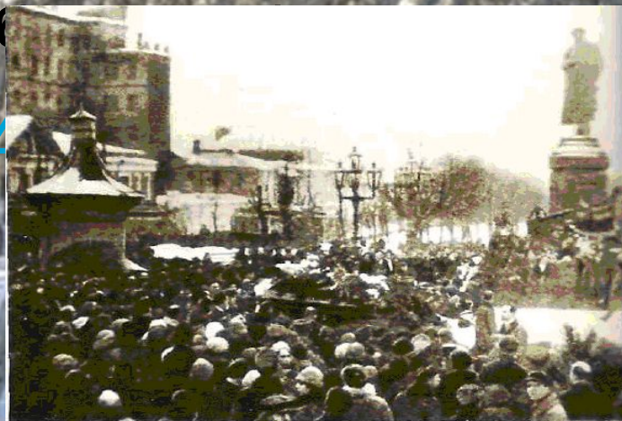
Похоронная процессия у памятника Пушкину. Москва