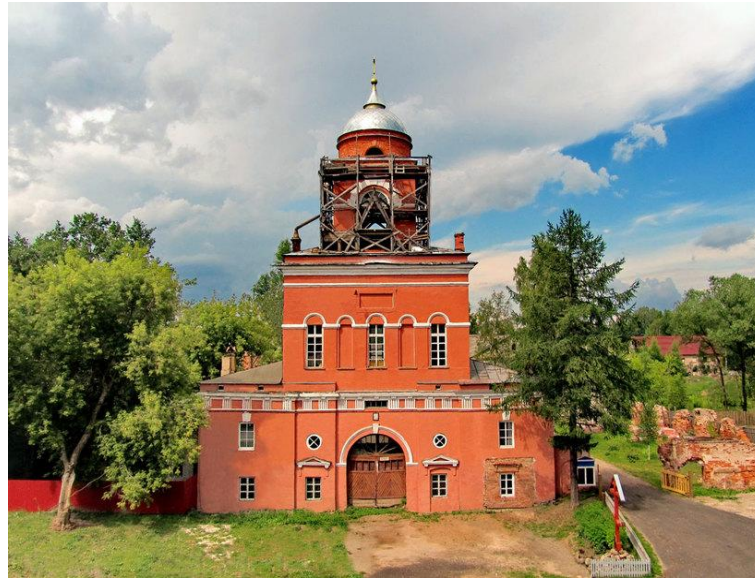
Тихвинский Введенский монастырь был основан в 1560 году.