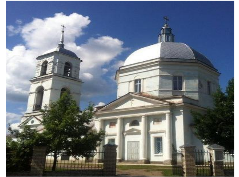
Церковь «Знамение» начала своё существование в XVI веке.