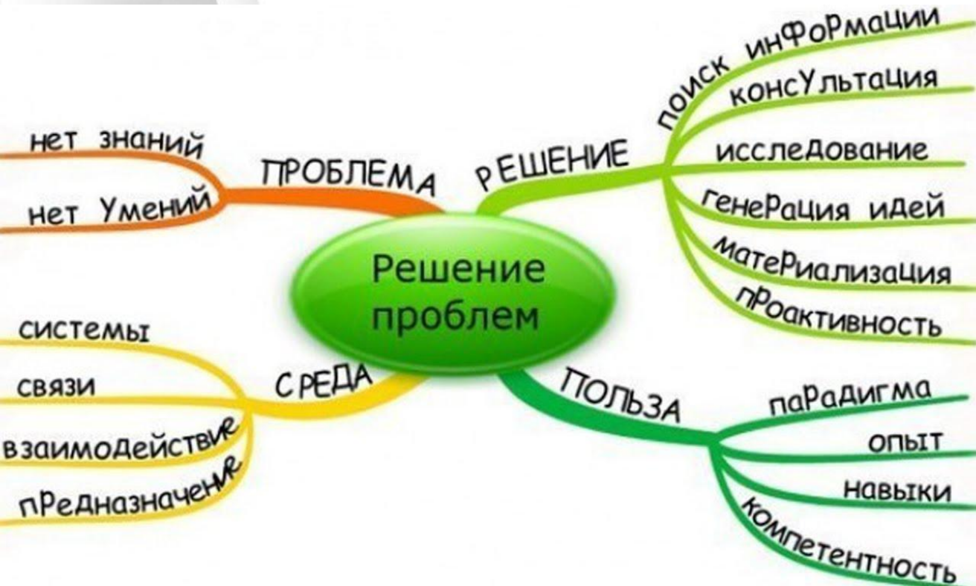
Схема решения проблемы