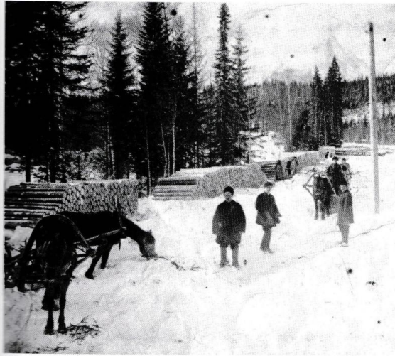
Заготовка древесины на одном из участков

Из выздоравливающих бойцов формировались бригады и посылали на станцию Калино для рубки дров. В 1942 году таким образом было заготовлено 1960 кубометров дров.