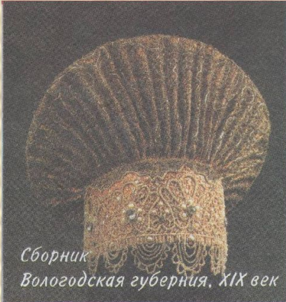
Сборник Вологодская губерния, XIX век