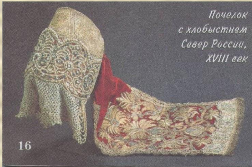
Пчелок с хлобыстнем Север России, XVIII век