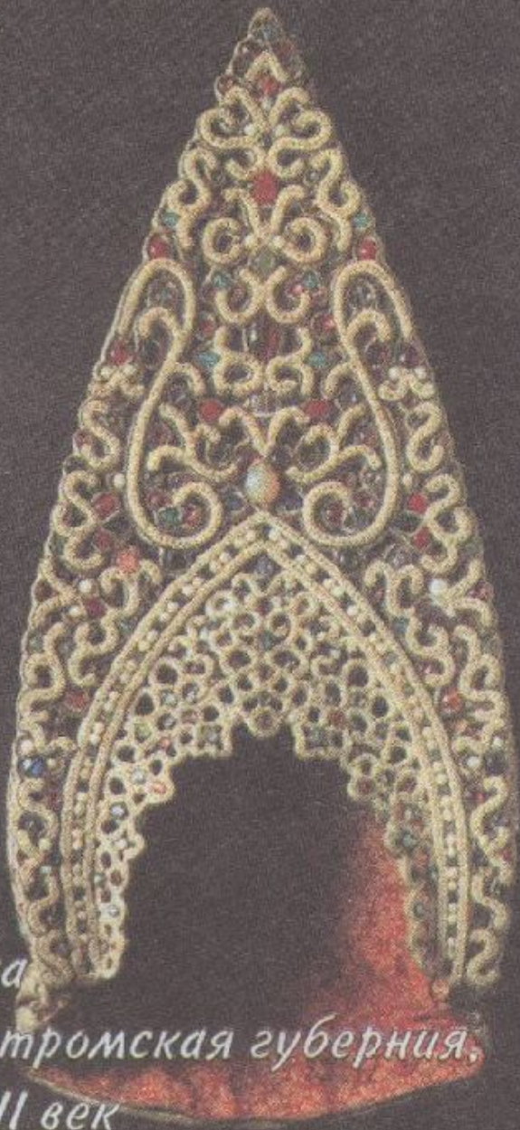
Кика Костромская губерния, XVIII век