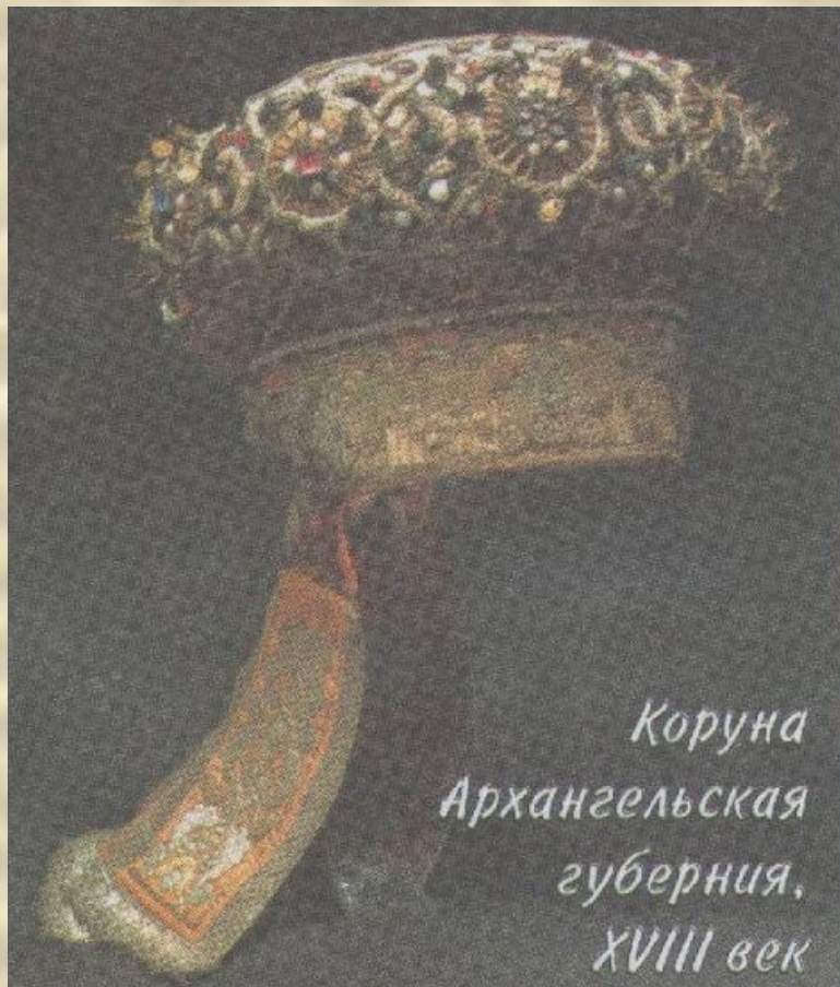
Коруна Архангельская губерния, XVIII век