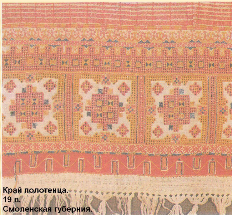
Край полотенца. 19 в. Смоленская губерния.