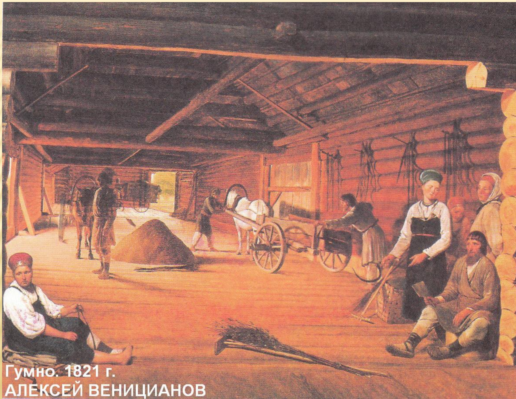
Гумно. 1821 г. АЛЕКСЕЙ ВЕНИЦИАНОВ