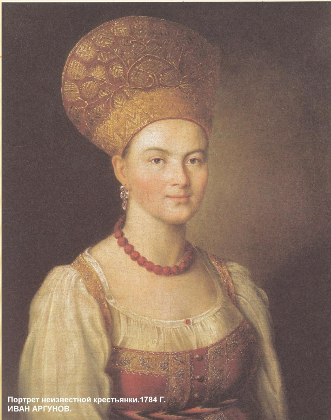
Портрет неизвестной крестьянки. 1784 Г. ИВАН АРГУНОВ.