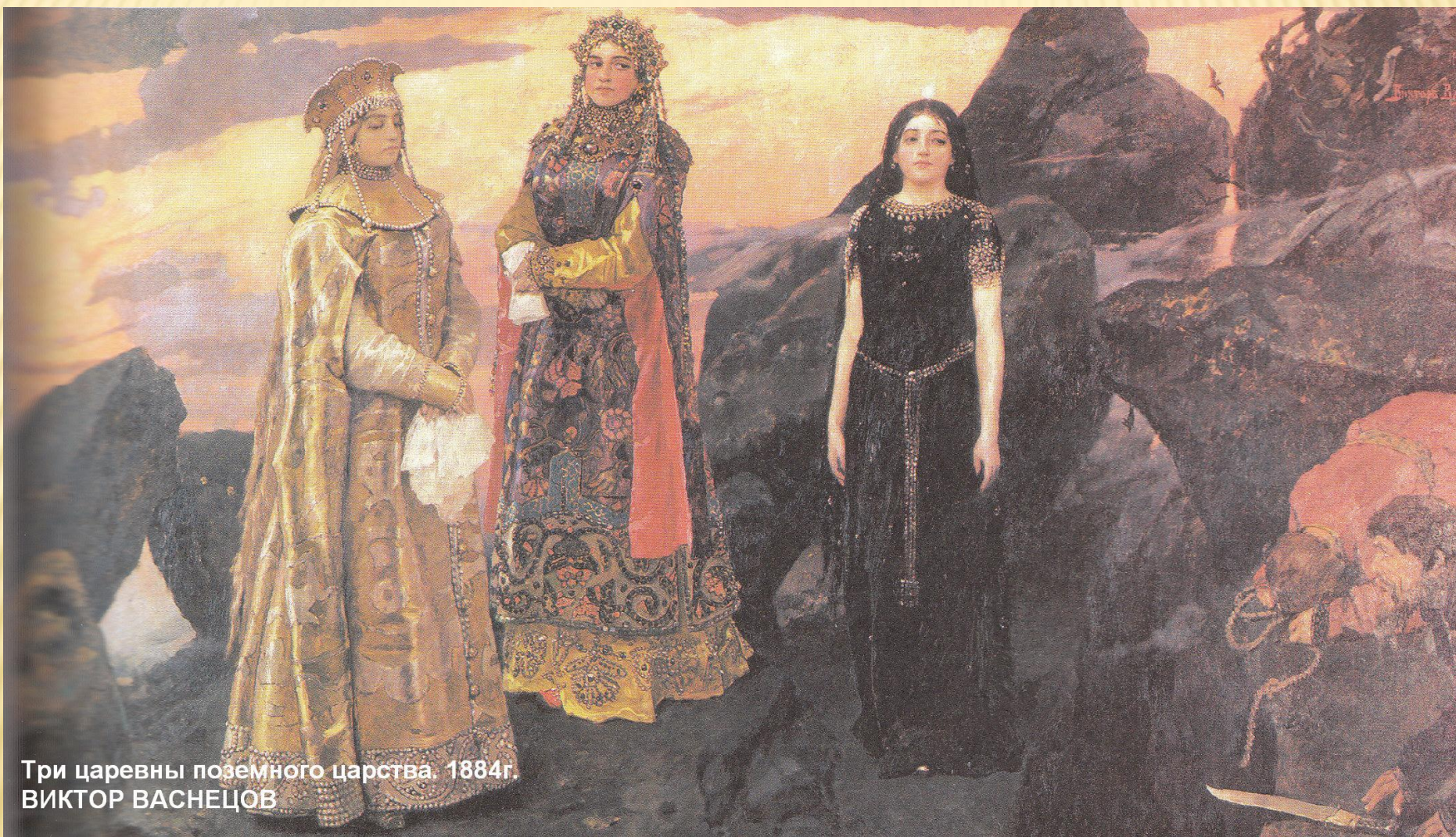
Три царевны подземного царства. 1884г. ВИКТОР ВАСНЕЦОВ