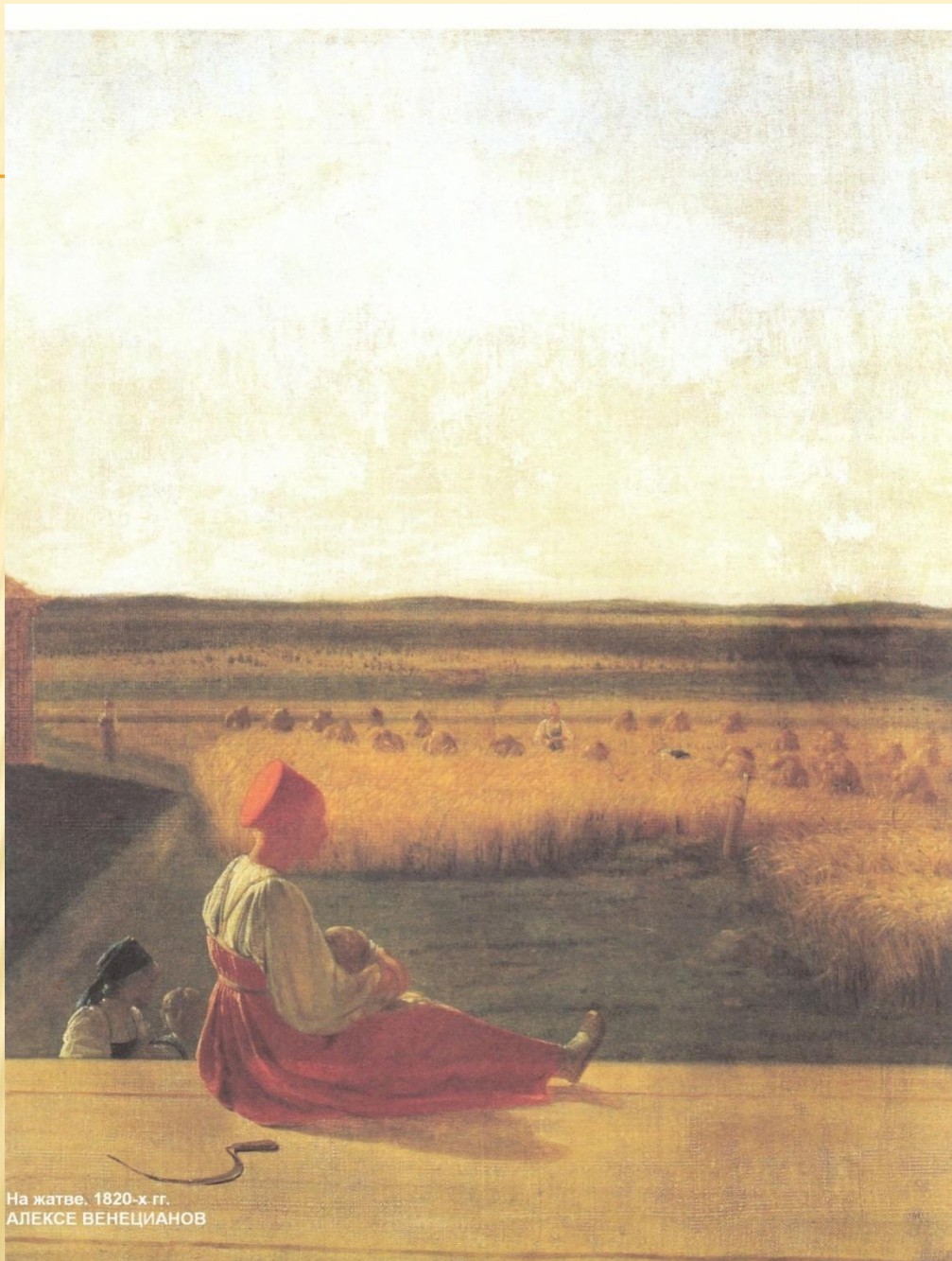
На жатве, 1820-х гг. АЛЕКСЕ ВЕНЕЦИАНОВ