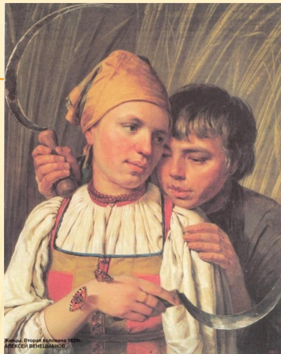
Женщина. Вторая половина 1820-х гг. АЛЕКСЕЙ ВЕНЕЦИАНОВ