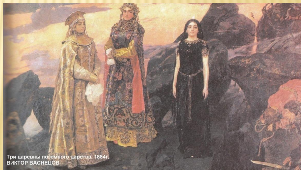
Три царицы подземного царства. 1884 г. ВИКТОР ВАСНЕЦОВ