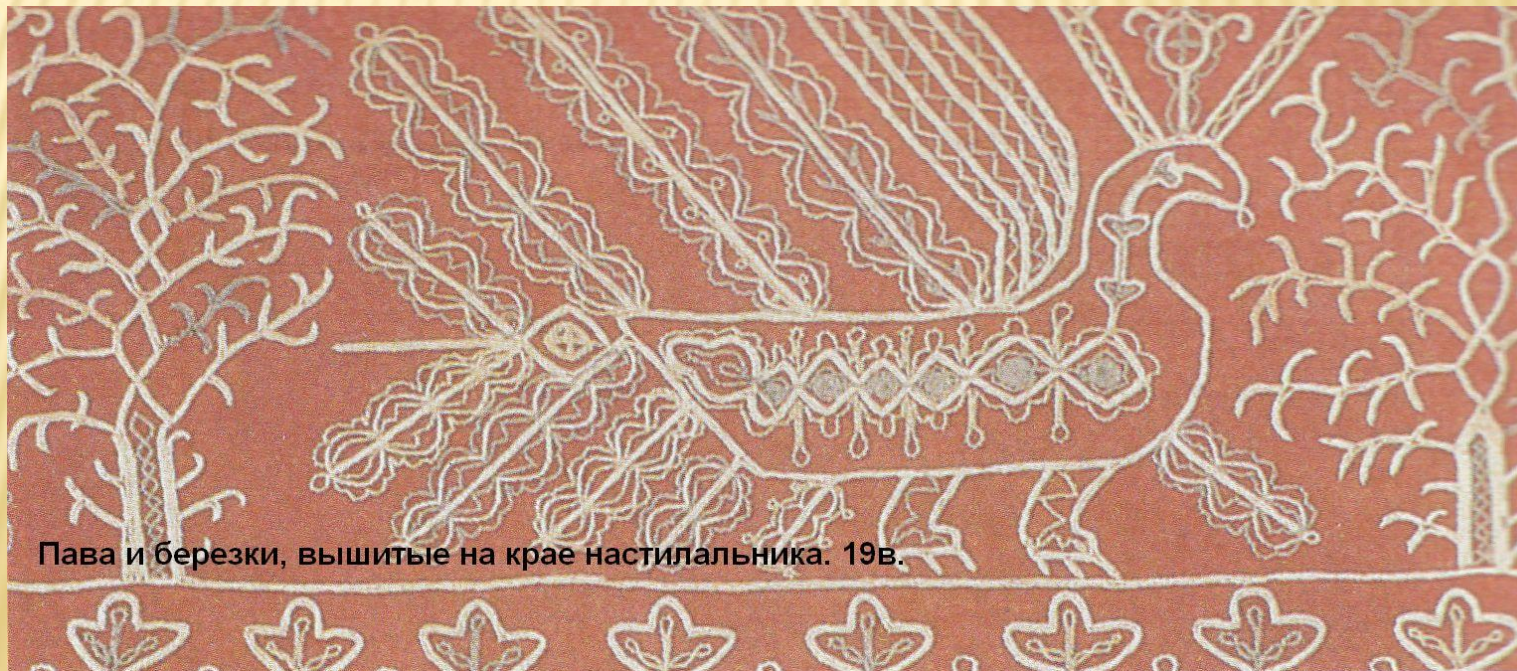
Пава и березки, вышитые на крае настилальника. 19в.