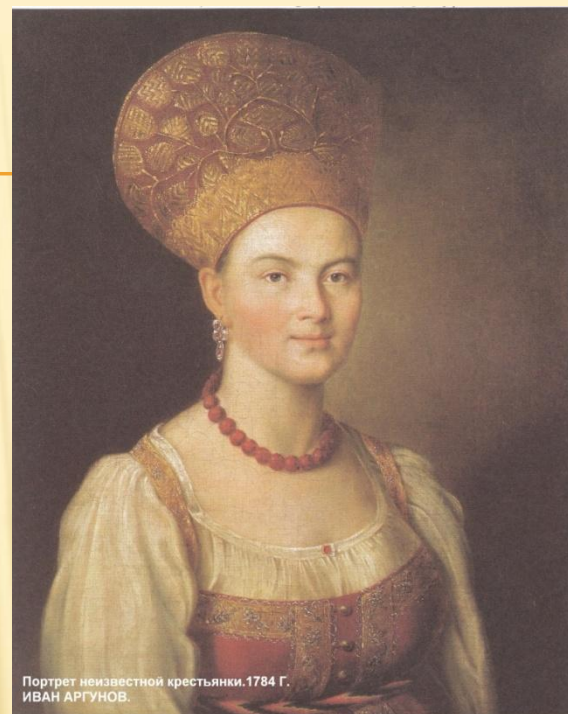
Портрет неизвестной крестьянки. 1784 г. ИВАН АРГУНОВ.