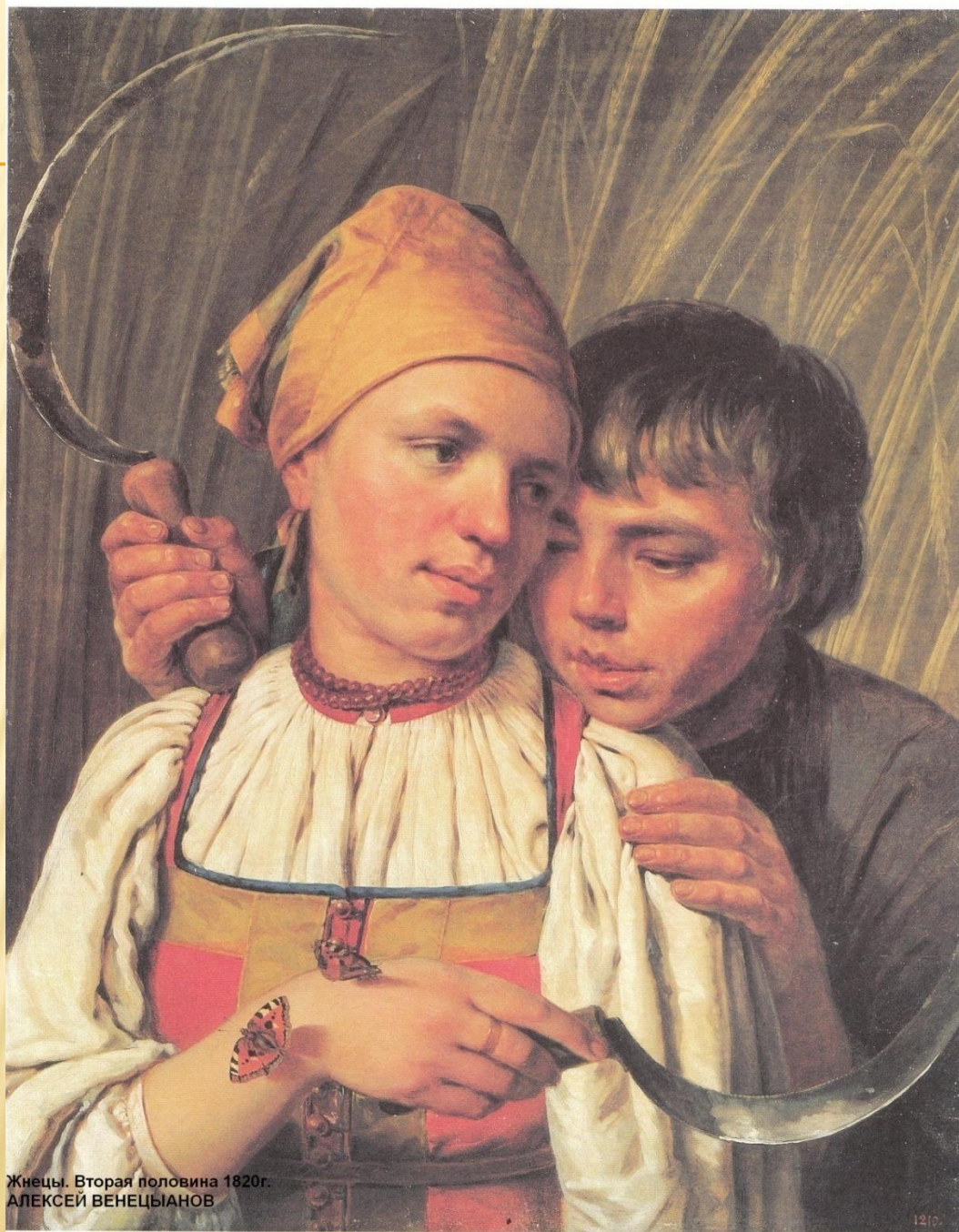
Жнецы. Вторая половина 1820-г. АЛЕКСЕЙ ВЕНЕЦЬЯНОВ