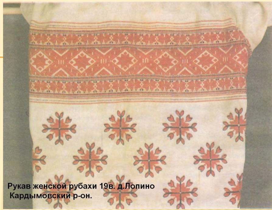
Рукав женской рубахи 19в. д. Лопино Кардымовский р-он.