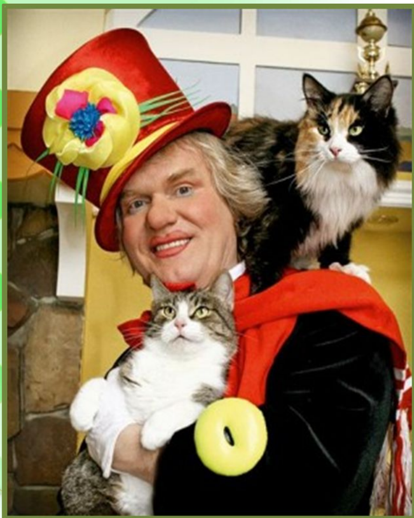
Дрессировщик Юрий Куклачев