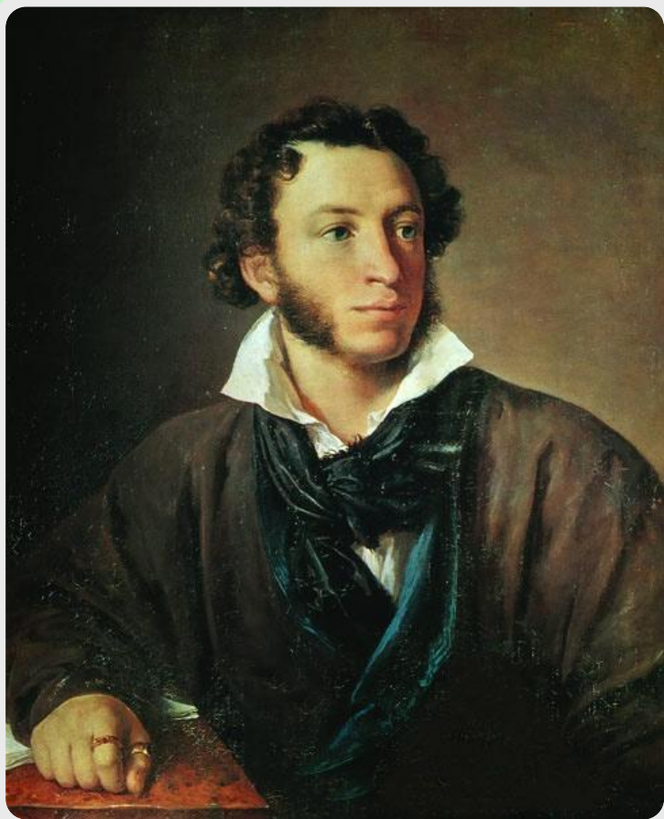
«Портрет А.С. Пушкина» В.А. Тропинин