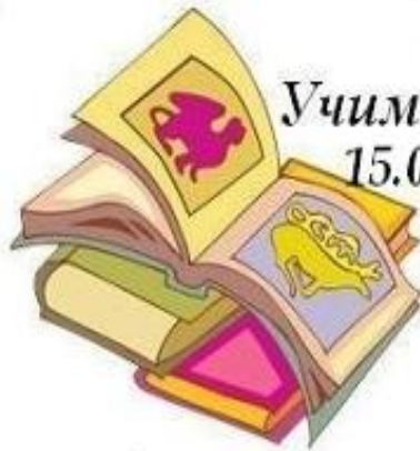
Учим уроки 15.00-17.00