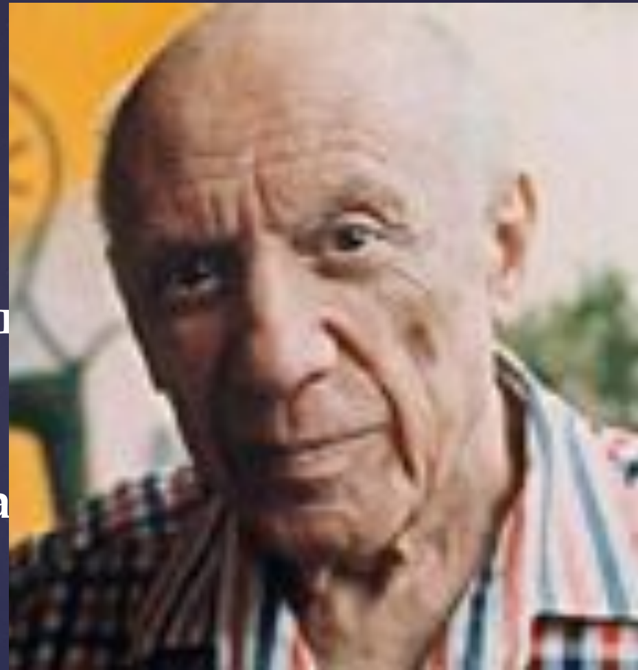
Пабло Пикассо испанский художник 1881-1973

Условность – это средство, с помощью которого художник передаёт свои мысли. П. Пикассо высказал свои мысли по этому поводу: «Мы все знаем, что искусство не есть истина. Искусство – ложь, но эта ложь учит нас постичь истину»