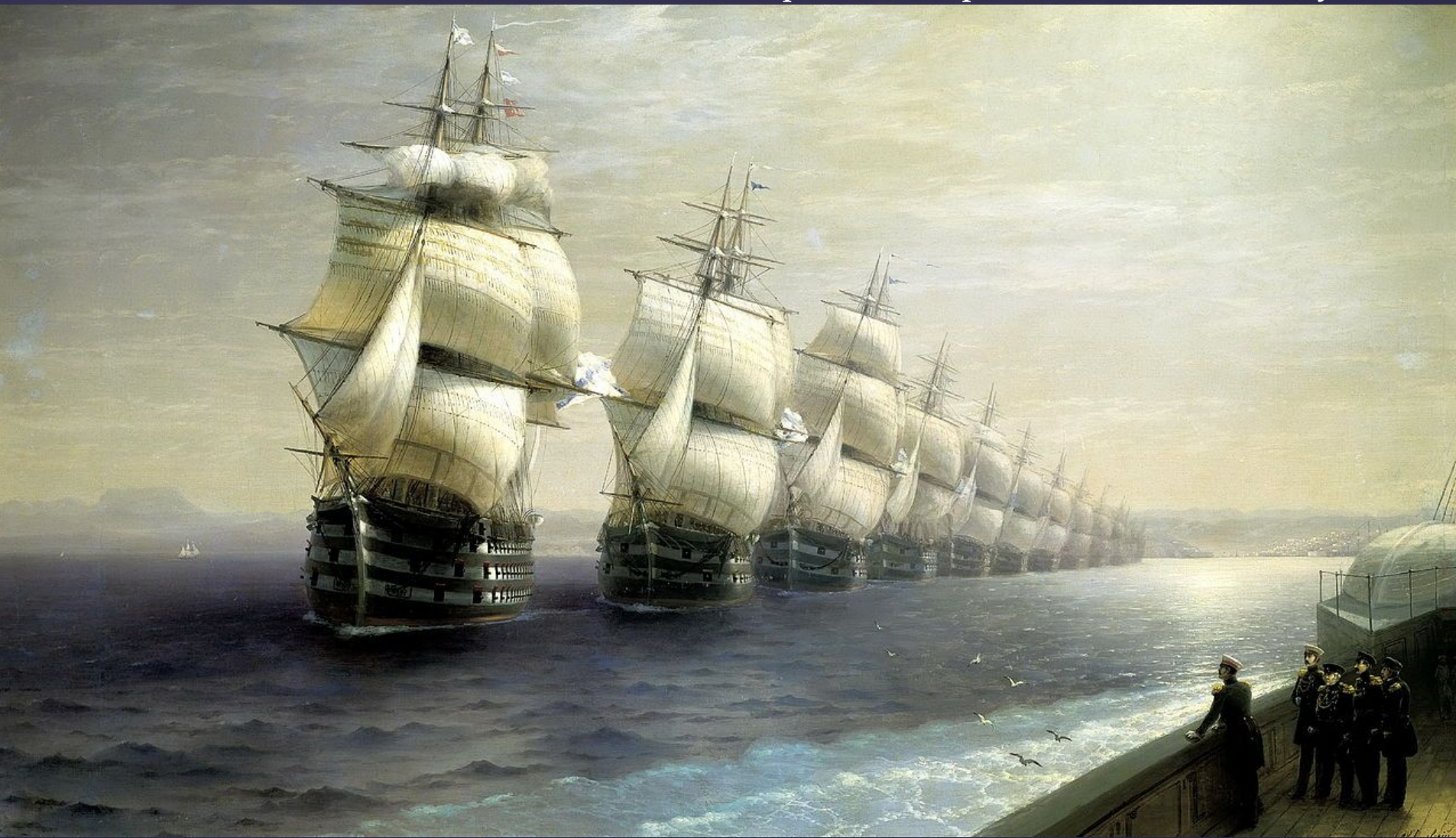
И. К. Айвазовский Смотр Черноморского флота в 1849 г.