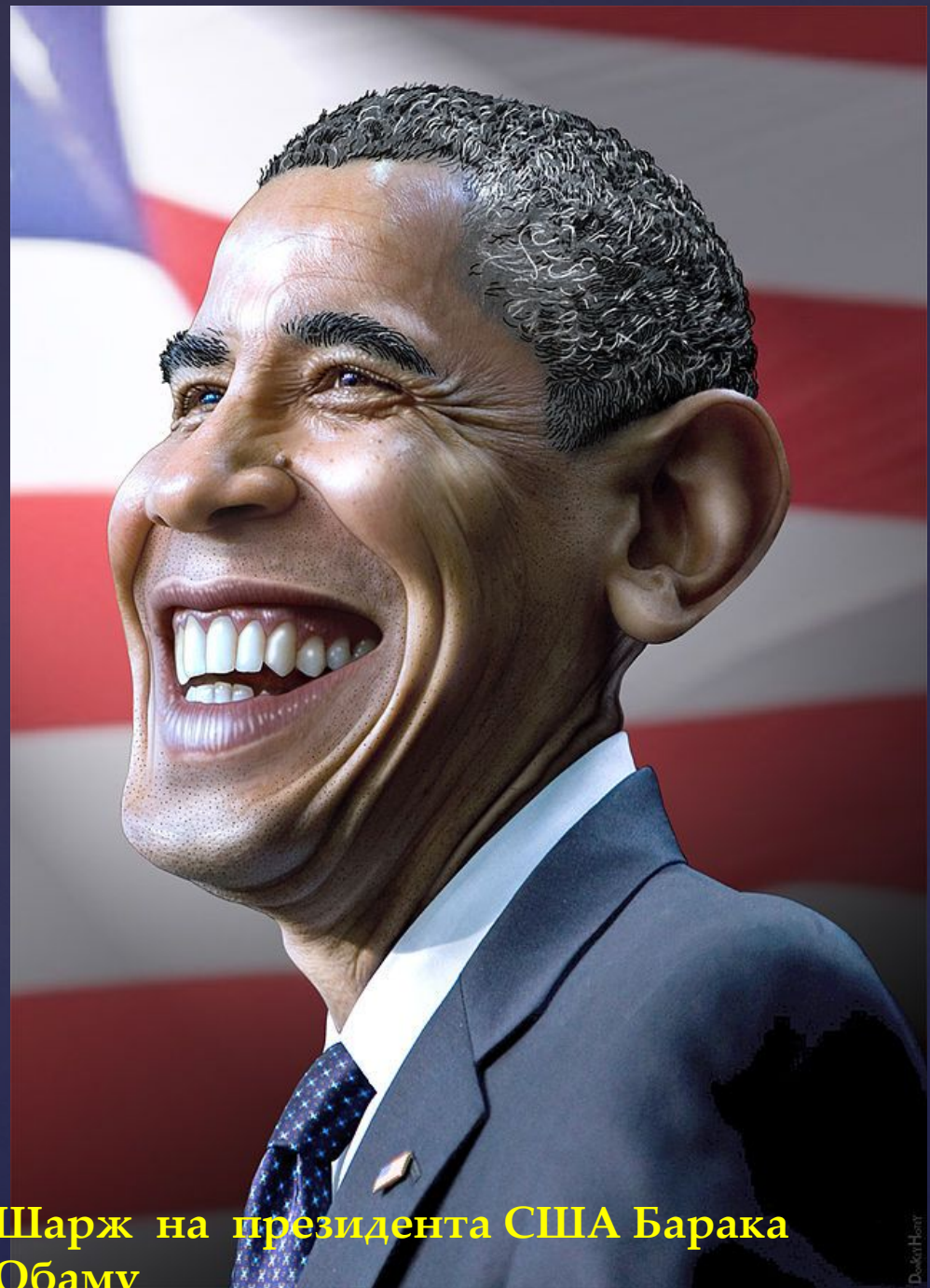
Шарж на президента США Барака Обаму