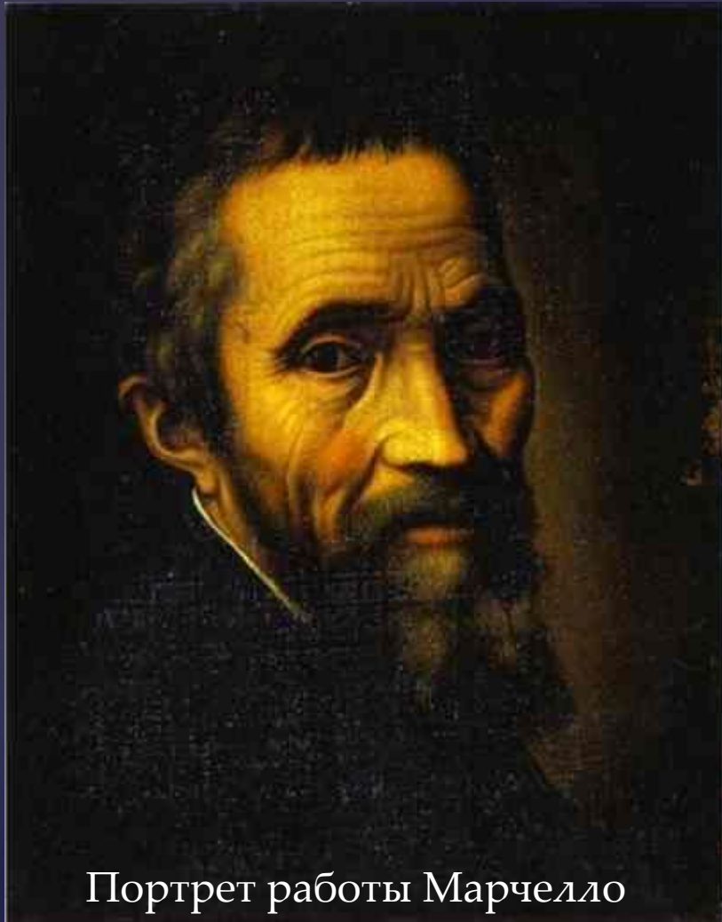
Портрет работы Марчелло Венусти (1535)

История искусства приводит пример о правде и правдоподобии (художественном вымысле).