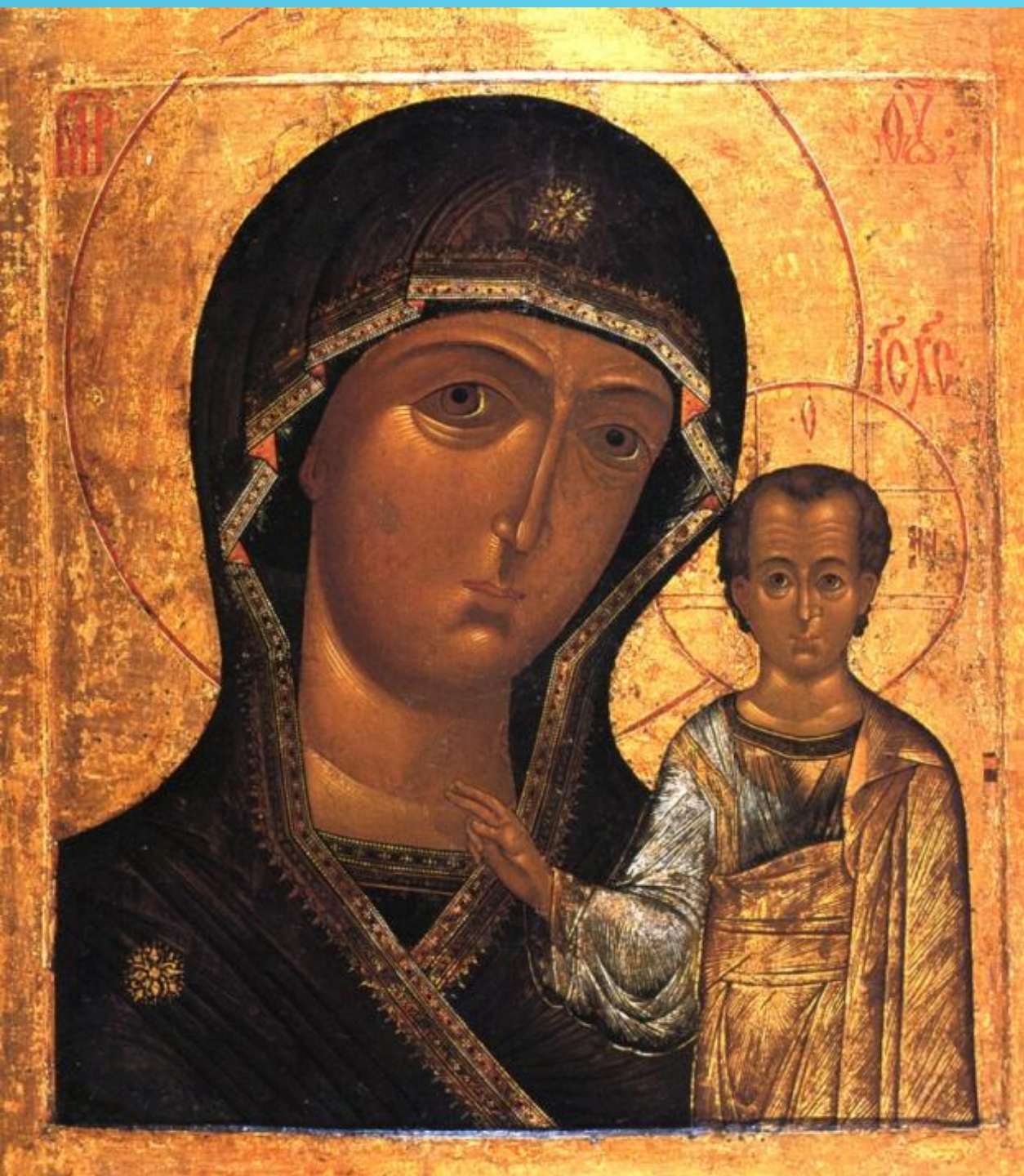
Икона Казанской Богоматери