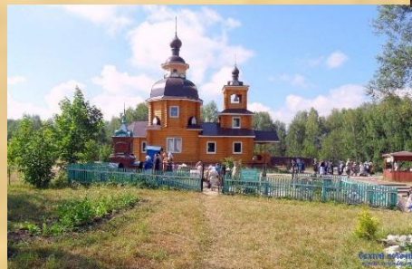
Этнотуристический маршрут по Советскому району РМЭ