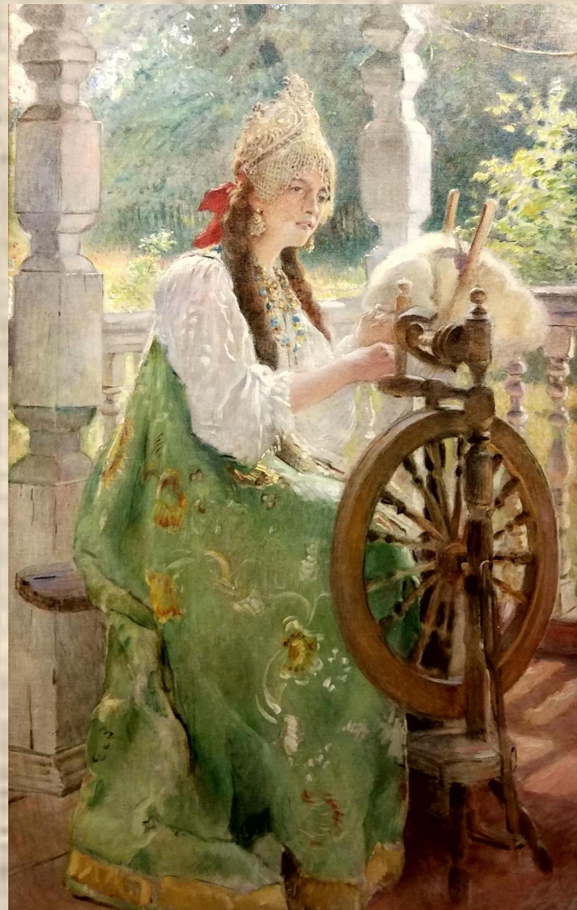
К.Е.Маковский За прялкой

Пряха - женщина, занимающаяся ручным прядением.