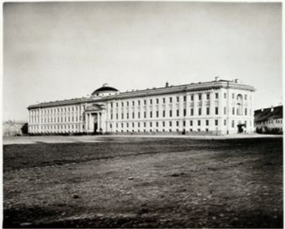
СУДЕБНОЕ УСТАНОВЛЕНИЕ В СЕНАТЕ

Указ о присылке из монастырей древних рукописей и печатных книг от 20 декабря 1720 г. Великий государь указал: во всех монастырях, обретающихся в Российском государстве, осмотреть и забрать древние жалованные грамоты и другие курioзные письма оригинальные, также книги исторические, рукописные и печатные, какие где потребные к известию найдутся. И по тому его великого государя именному указу, правительствующий Сенат приказали: во всех епархиях и монастырях, и соборах прежние жалованные грамоты и другие курioзные письма оригинальные, такожде и исторические рукописные и печатные книги пересмотреть и переписать губернаторам и вице-губернаторам, и воеводам и те переписные книги прислать в Сенат.