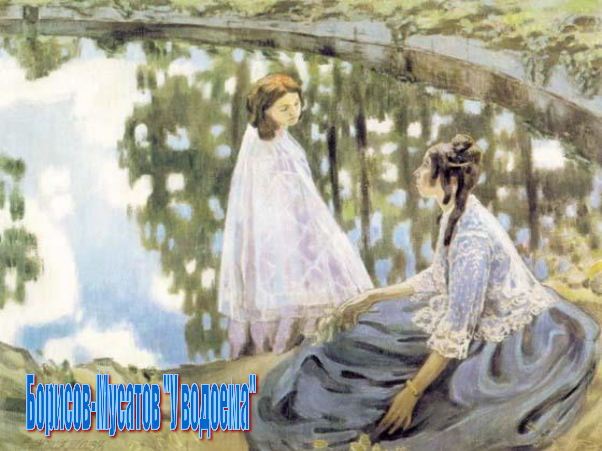
Борисов-Мусатов "У водоема"