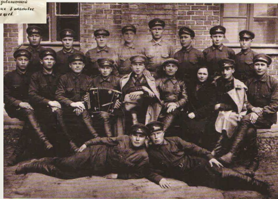
Бойцы 147 – ой стрелковой дивизии