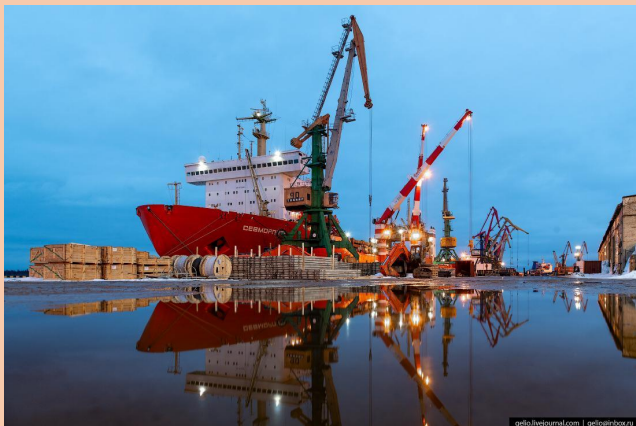
← der Hafen