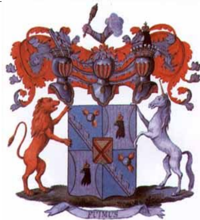
Герб династии Голицыных