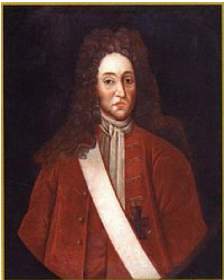
Волконский Никита Федорович

Историки пишут, что Анна из чувства мести сделала шутами князей Голицина Михаила Алексеевича, Волконского Никиту Федоровича и Алексея Петровича Апраксина. Роли для них она выбирала самые унижительные, например, камергеру князю Никите Федоровичу Волконскому, который был уже пожилой и болезненный человек, императрица поручила заботы и уход за своей любимой левреткой Цитринкой.