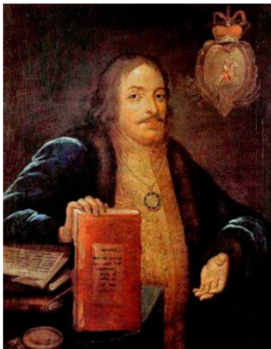
Князь М.А. Голицын

По высочайшему повелению были доставлены в Петербург со всей России пары – представители разных народов, населяющих владения императрицы (всего 150 пар, т.е. 300 человек), которые должны были войти в состав свадебной процессии. Маскарадная комиссия распорядилась о том, чтобы пары были одеты в национальную одежду, также участников снабдили национальными музыкальными инструментами.