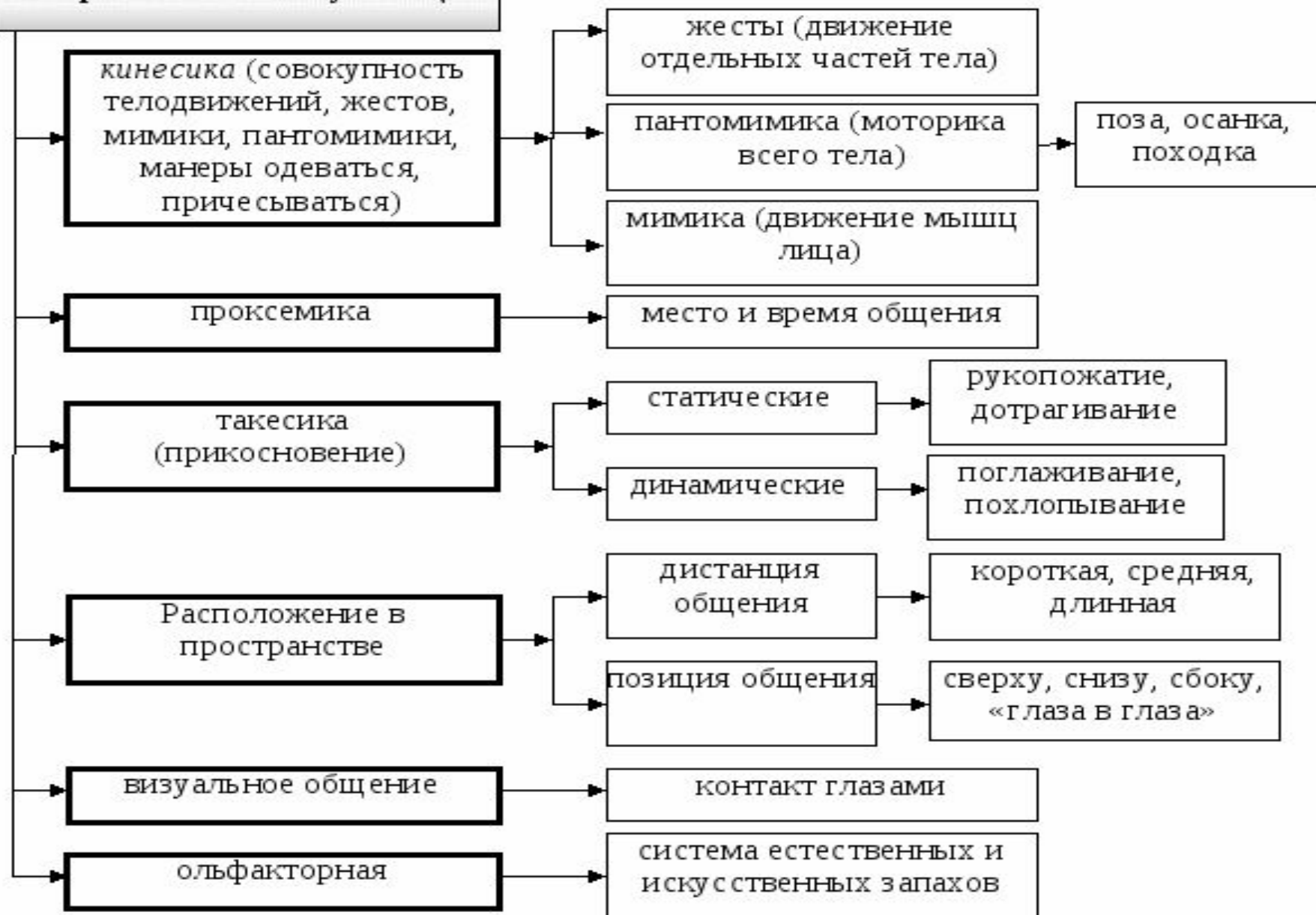
Рисунок 2. Структура невербальной коммуникации