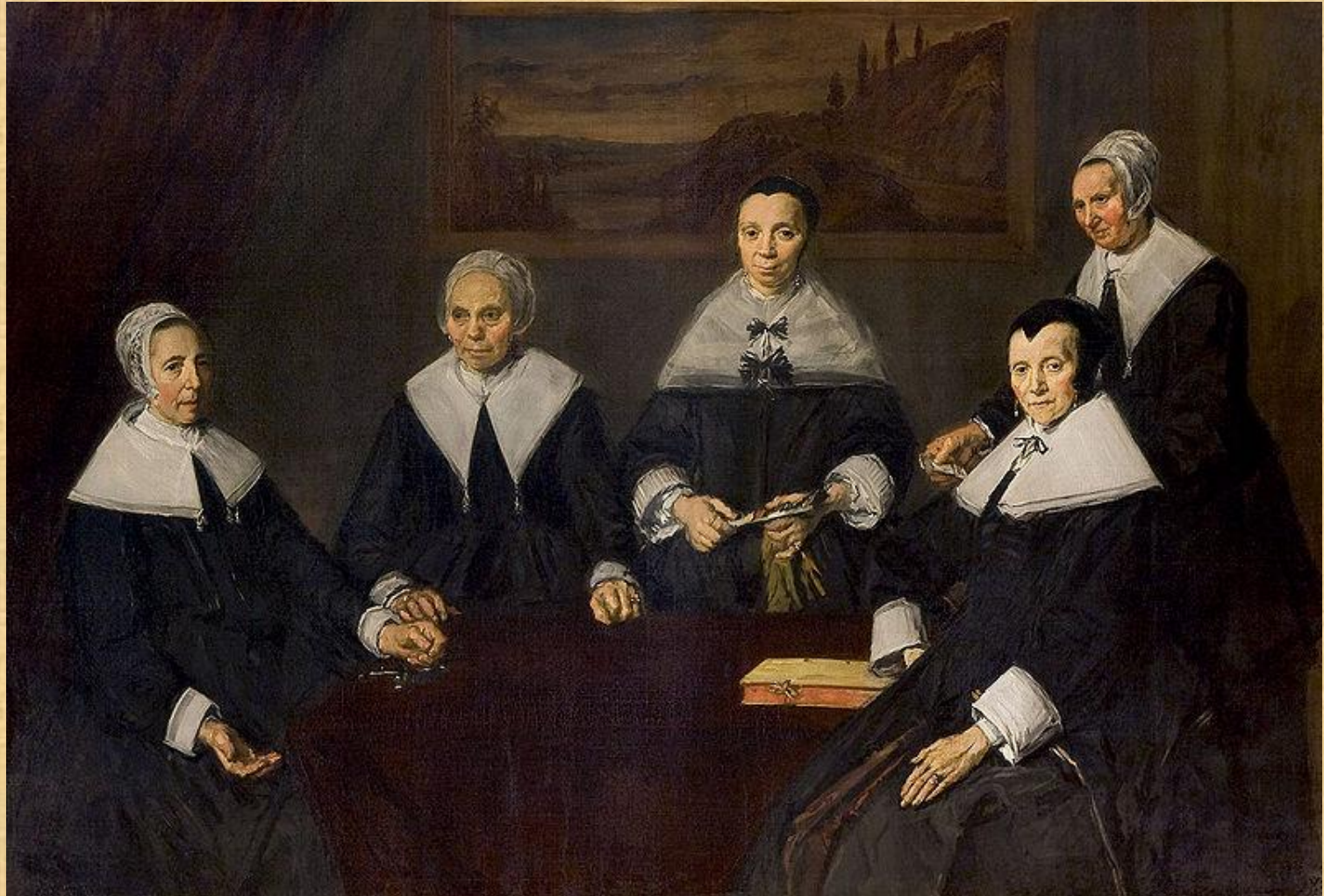
Регентши приюта для престарелых

Высшее достижение Хальса — его последние групповые портреты регентов и регентш (попечителей) приюта для престарелых, исполненные в 1664 г., за два года до смерти художника, одиноко окончившего жизненный путь в приюте.