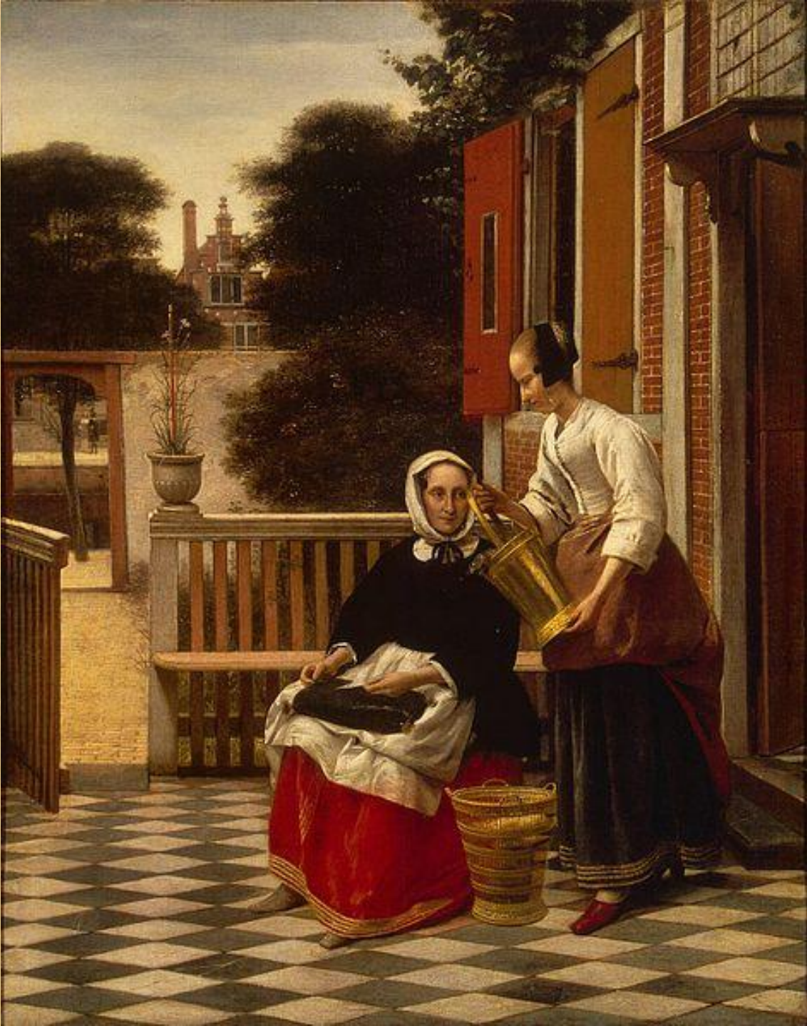
Хозяйка и служанка