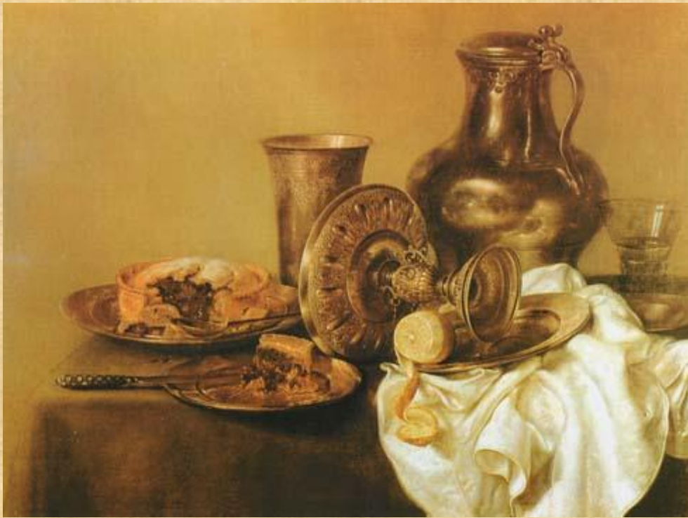
Хеда Виллем Клас Натюрморт с золотым кубком

Хеда , а также оказавший на него влияние Питер Клас — самые значительные представители такого рода натюрмортов в Голландии. Этих двух харлемских мастеров часто сравнивают. Оба они создавали скромные «завтраки» с простым набором незамысловатых предметов. Хеду и Класа роднят зеленовато-серые или коричневатые тона, но произведения Хеды, как правило, более тщательно отделаны, а вкус его более аристократичен, что проявлялось в выборе изображаемых объектов: серебряной, а не оловянной утвари, устриц, а не сельди и т. п.