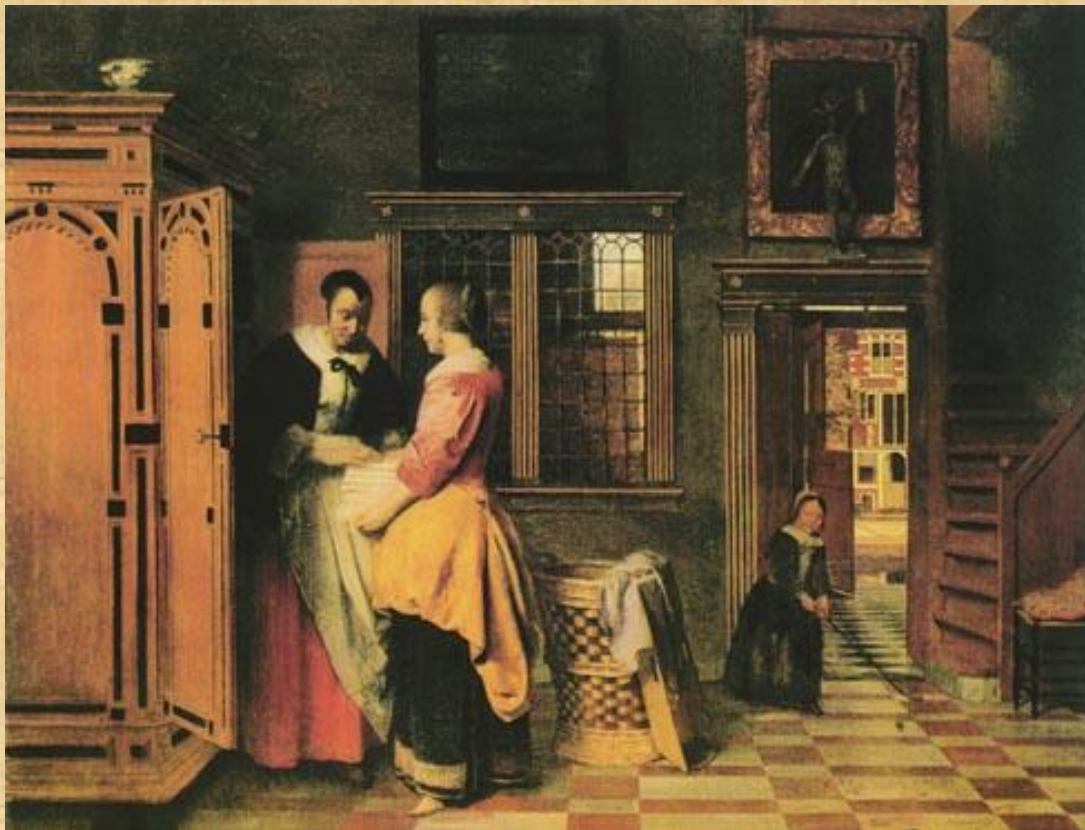
Питер де Хох У бельевого шкафа

Самым популярным в голландской живописи был бытовой жанр , во многом определивший своеобразные пути ее развития по сравнению с искусством других стран. Обращение к самым различным сторонам повседневной жизни, ее поэтизация обусловили формирование разнообразных типов жанровых картин. Высокое живописное мастерство их создателей, оптимистический характер, мягкий лиризм сообщают им то обаяние, которое оправдывает изображение самых незначительных мотивов.