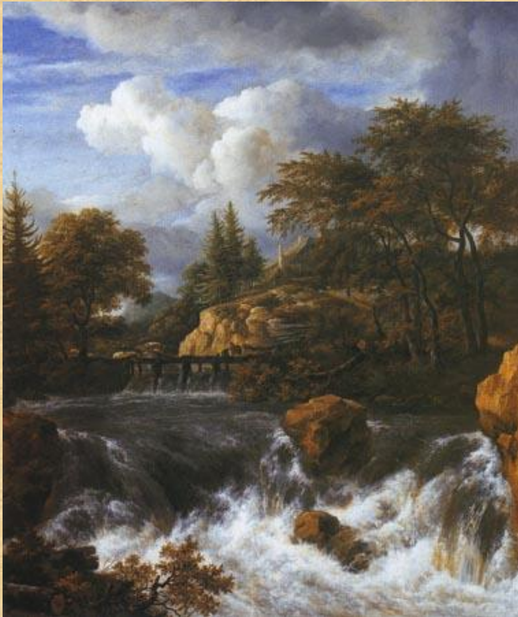
Скалистый пейзаж с водопадом