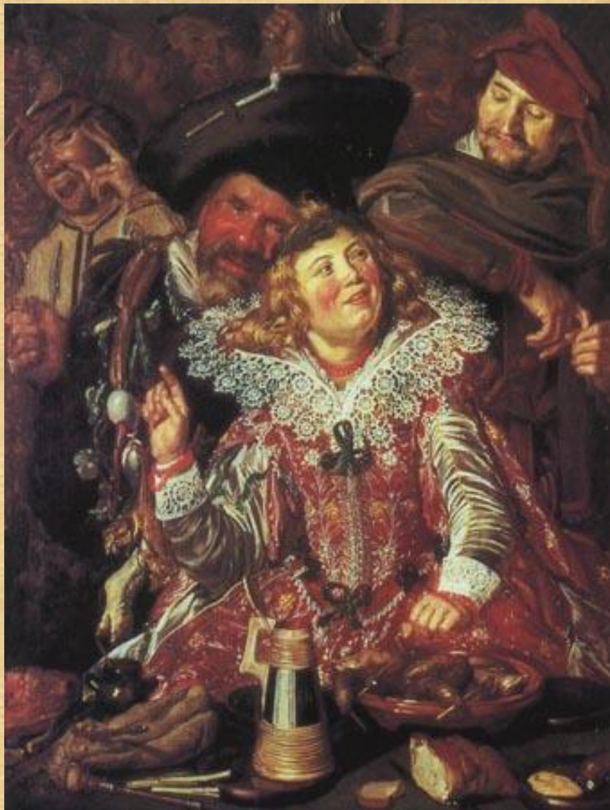
Франс Хальс Масленичное гулянье

Главным объектом изображения для голландских художников была окружающая действительность, никогда ранее не находившая столь полного отображения в произведениях живописцев других национальных школ. Обращение к самым различным сторонам жизни приводило к укреплению реалистических тенденций в живописи, ведущее место в которой заняли бытовой жанр и портрет, пейзаж и натюрморт. Чем правдивее, глубже отражали художники открывающийся перед ними реальный мир, тем более значительными были их произведения.