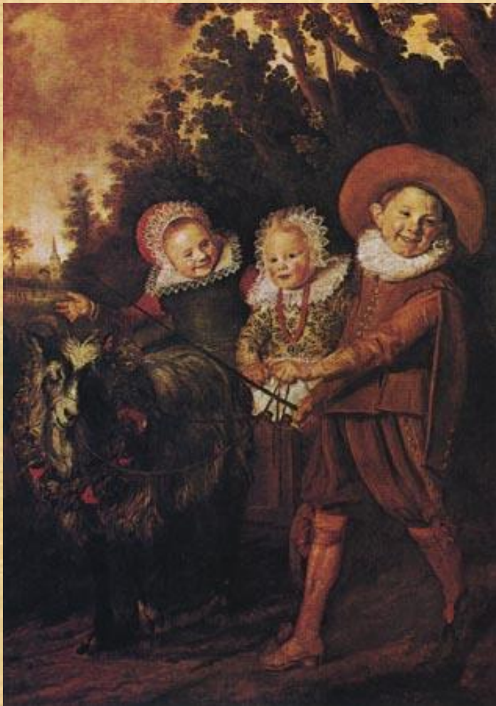
Франс Хальс Группа детей

В каждом жанре существовали свои ответвления. Так, например, среди пейзажистов были маринисты (изображавшие море), живописцы, предпочитавшие виды равнинных мест или лесные чащи, были мастера, специализировавшиеся на зимних пейзажах и на пейзажах с лунным светом: среди жанристов выделялись художники, изображавшие крестьян, бюргеров, сцены пирушек и домашнего быта, сцены охоты и рынков; были мастера церковных интерьеров и различных видов натюрмортов — «завтраков», «десертов», «лавок» и т. п. Сказались черты ограниченности голландской живописи, сужавшей для ее создателей число решаемых задач. Но вместе с тем сосредоточение каждого из художников на определенном жанре способствовало отточенности мастерства живописца. Только самые крупные из голландских художников работали в различных жанрах.