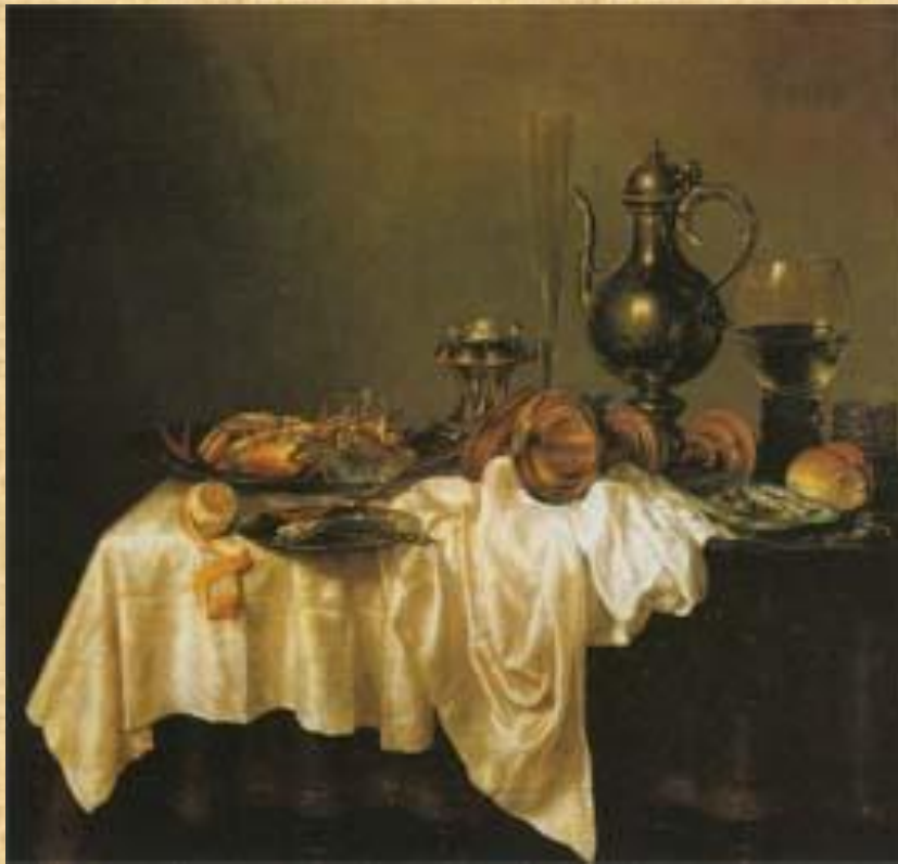
Хеда Виллем Клас Завтрак с крабом

В Голландии XVII в. жанр натюрморта получил большое распространение. Эстетические принципы натюрморта были довольно консервативными: горизонтальный формат полотна, нижний край стола с изображаемой натурой строго параллелен раме. Складки на столовой скатерти, как правило, уходили параллельными линиями, вопреки законам перспективы, в глубину полотна; предметы рассматривались с высокой точки зрения (чтобы легче было охватить их все взглядом), располагались в линию или по кругу и практически не соприкасались