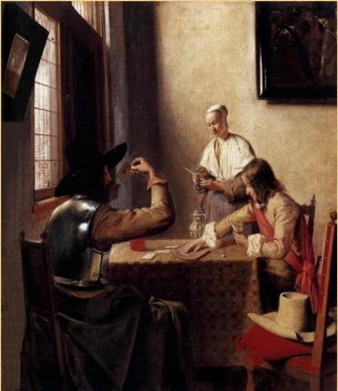
Солдаты, играющие в карты