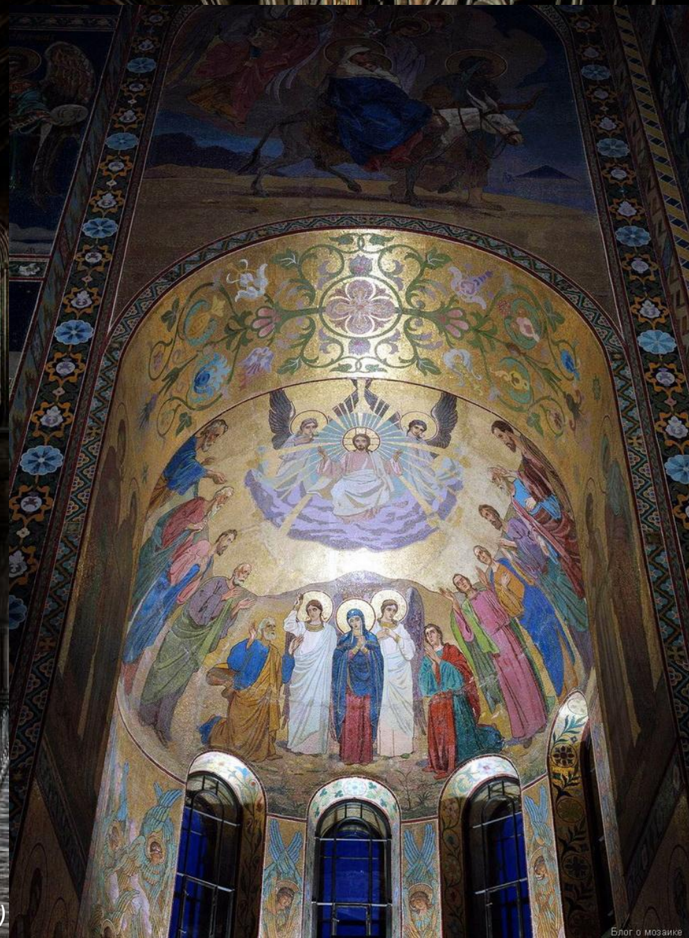
Вознесение Христово (художник В.П. Павлов)

С тех пор и до конца 19 столетия было создано множество полотен на темы, связанные с жизнью Христа. Лучшие художники России посвятили Иисусу Христу не просто отдельные произведения, но целые циклы, а также нередко значительную часть своей творческой биографии.