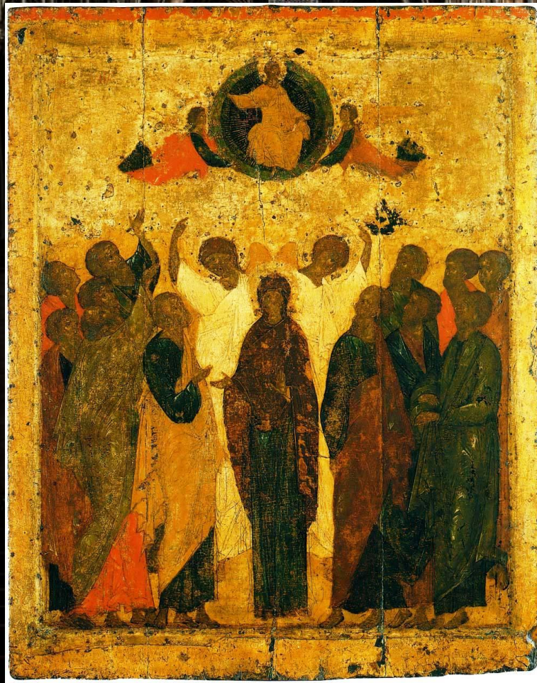
Андрей Рублёв "Вознесение"