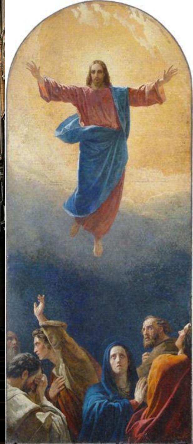
Вознесение Христа. По оригиналу Т. А. Неффа. Вторая половина 1800-х. Мозаика. Исполнили М. Зоценко, В. С. Болотнов, И. Вершинин.

Рисунок для художников первой половины XIX века был отдушиной, когда они обращались к библейским сюжетам. Особенно это касалось эскизов на церковные образа, заказываемые им тогда в огромных количествах.