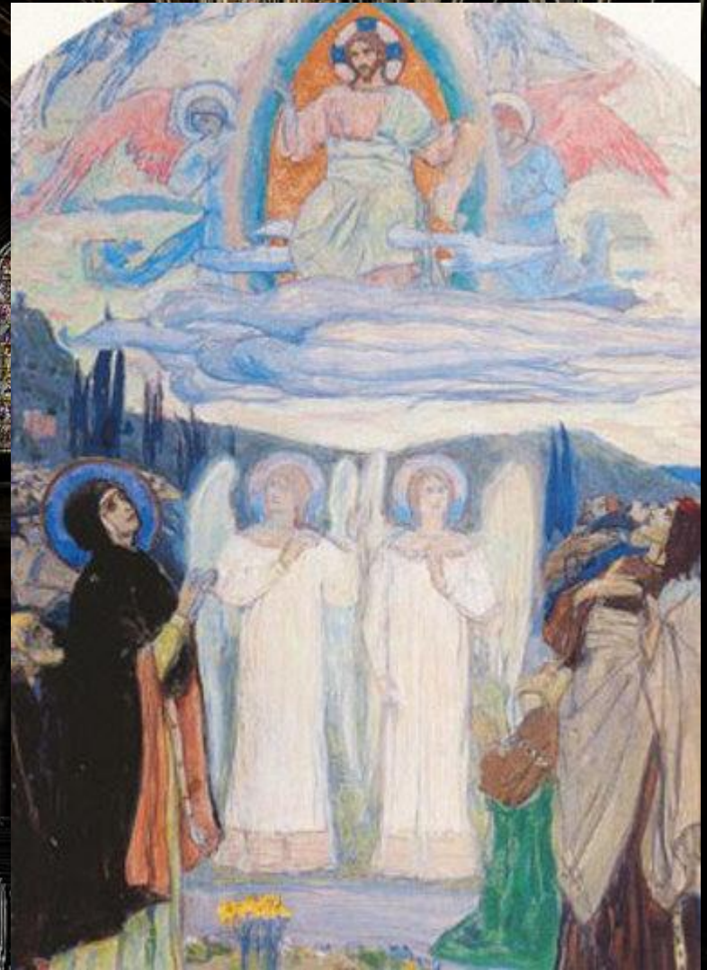
Вознесение Господне. М. В. Нестеров. 1898 г.

Каждый этап в истории русской религиозной живописи в XVIII столетии неизбежно перекликался с общими тенденциями в развитии искусства и отражал черты его художественного облика.