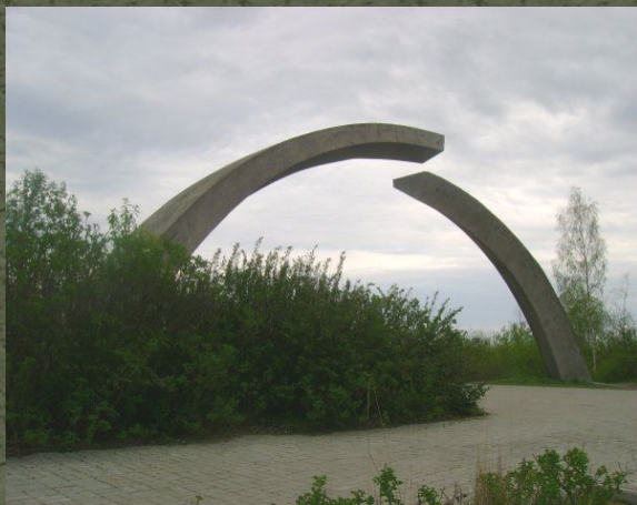
Памятник в честь разрыва блокады Ленинграда.

Блокада Ленинграда стала самой кровопролитной осадой в истории человечества