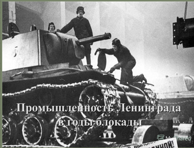
Промышленность Ленинграда в годы блокады

Голодные измученные люди находили в себе силы работать.