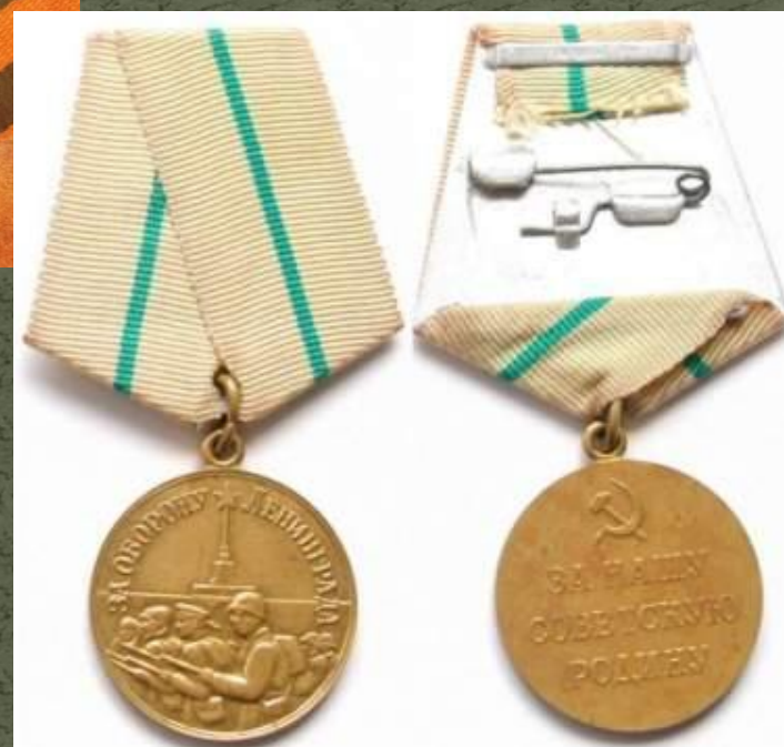
Медаль за оборону Ленинграда

Указом Президиума Верховного Совета СССР Город-герой Ленинград был награждён орденом Ленина и медалью «Золотая Звезда».