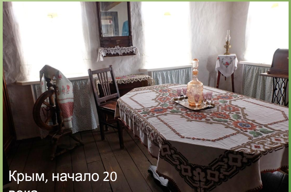
Крым, начало 20 века

Любой дом- бедный или богатый, обязательно украшали, создавали уют.