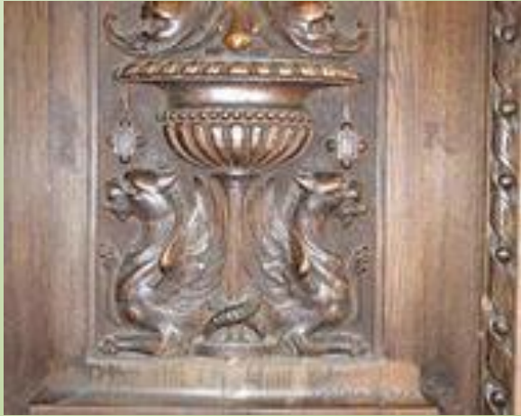
Резьба по дереву крымских татар

Любовь к резьбе по дереву была свойственна человеку с языческих времен.