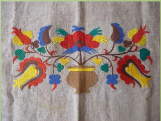
Изделия вышивальщиц Крыма