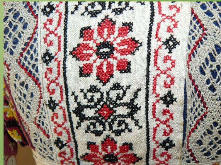
Изделия вышивальщиц Вологодской области