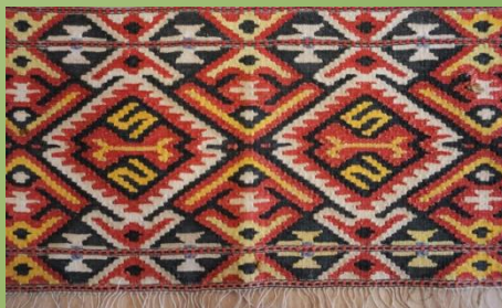
Работы мастеров Крыма