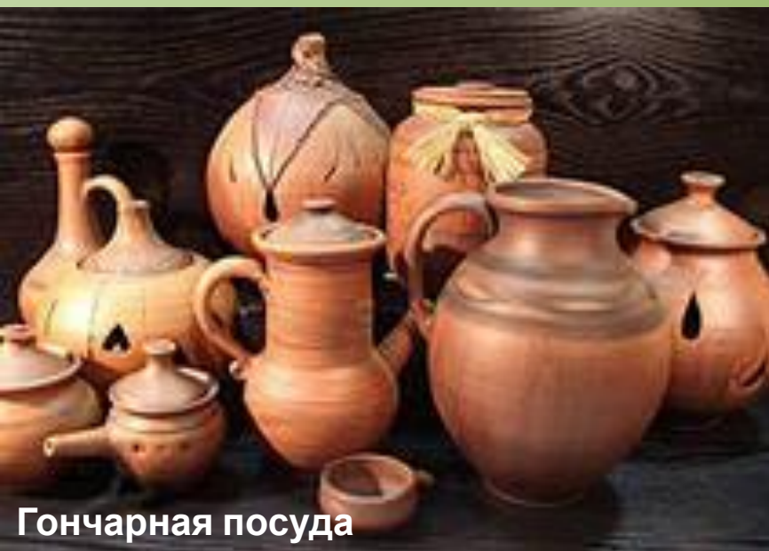
Гончарная посуда крымчан

На вологодской земле было немало очагов гончарного искусства. Здесь делали в основном повседневные миски, горшки простых форм. Особенно известным промысел стал в 1920 – 1930-е годы, когда мастера попробовали свои возможности в создании декоративной скульптуры и игрушки.