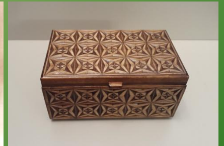
Резьба по дереву вологодских мастеров