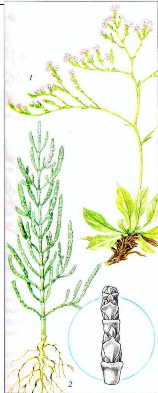
Рис. 44. Солевыносливые растения: 1 – гонолимон татарский; 2 – солерос (общий вид растения и участок побега с чешуевидными листьями)