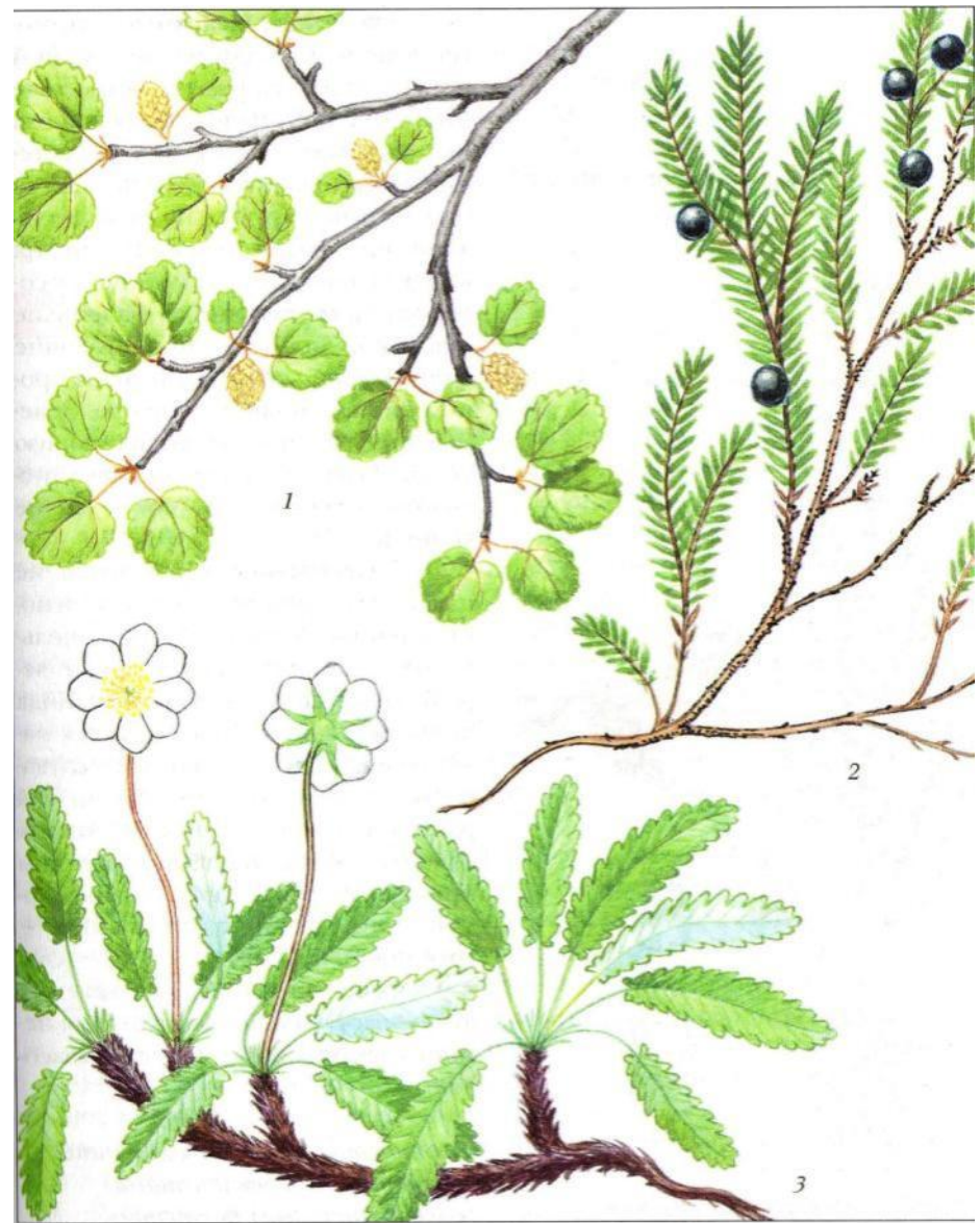
Рис. 43. Тундровые растения: 1 – карликовая березка; 2 – водяника; 3 – куропаточья трава