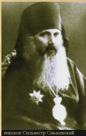
епископ Сильвестр Ольшевский

Еще в нем есть «рака с мощами святого Сильвестра»