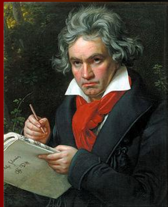
Людвиг ван Бетховен