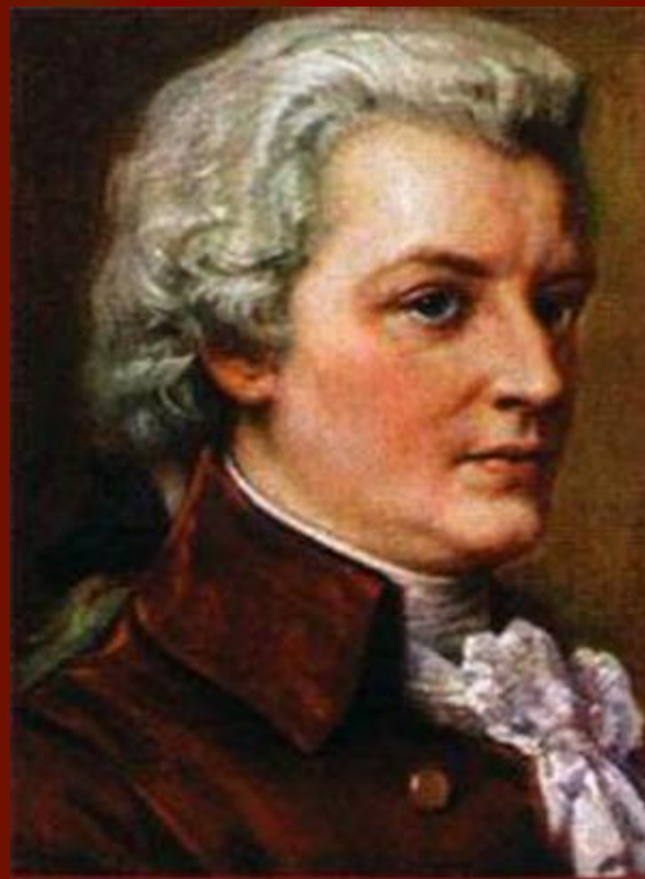
Вольфганг Амадей Моцарт