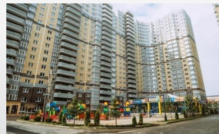
Жилые микрорайоны «Левенцовский», «Платовский», «Суворовский», «Красный Аксай»