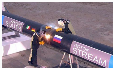
Газопровод «Южный поток»