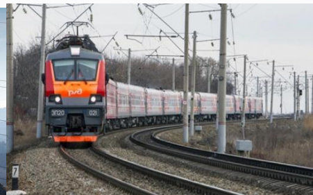
Железная дорога в обход Украины