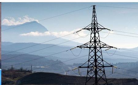
Линия электропередачи в Республику Крым