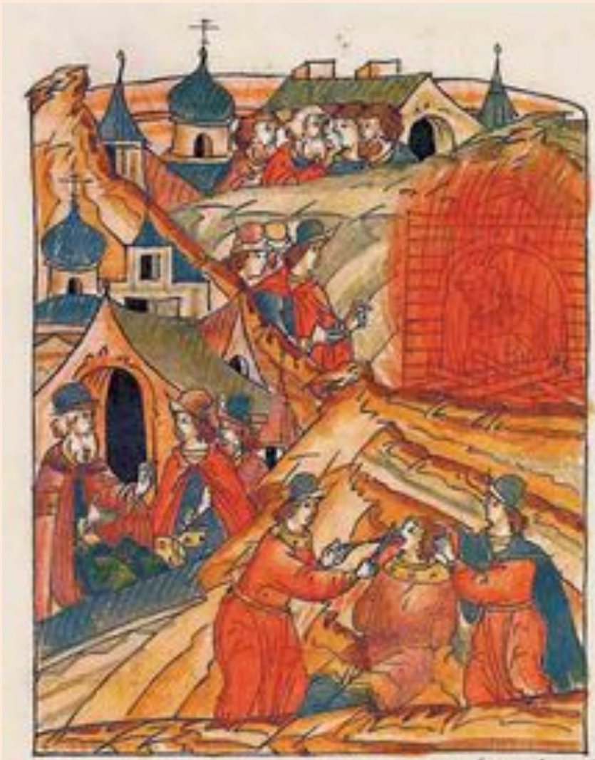
Казни еретиков жидовствующих в 1504 году.