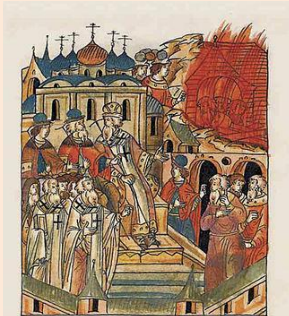
Казнь московских еретиков