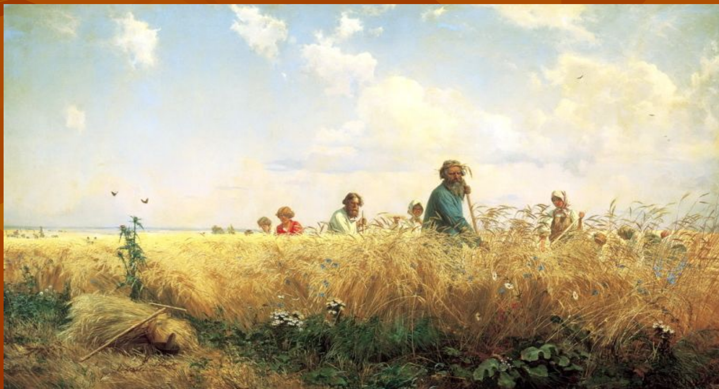
Картина: Мясоедов Григорий – Страдная пора (Косцы)