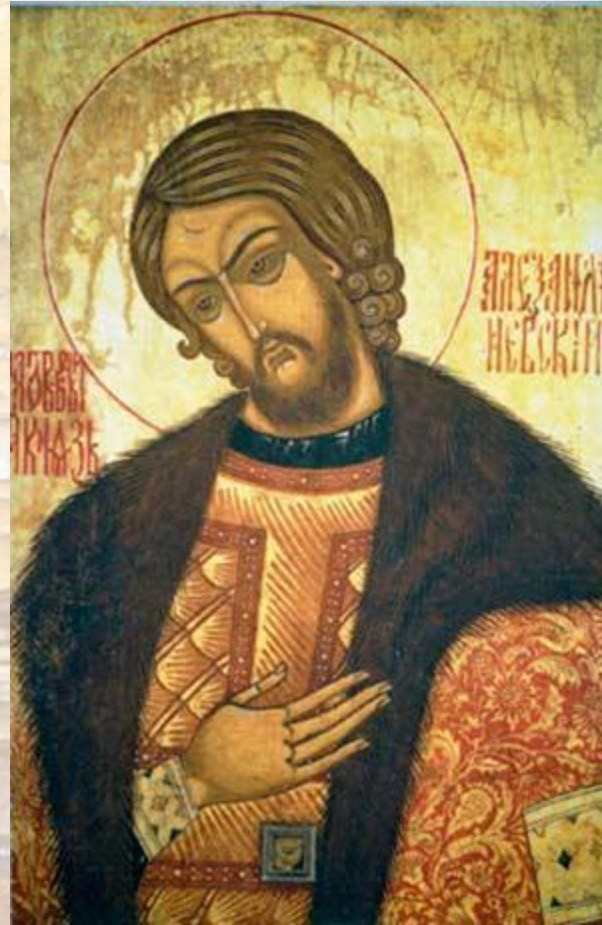
Святой князь Александр Невский. Икона