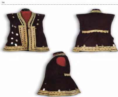
Рис. 208. Ковалюк, Юго-восточный край Китая, Ташань — фабричное сукно, отделка золотым ладунигом, алмазами. Сибирский историко-краеведческий музей, СЭМ СО № 1020