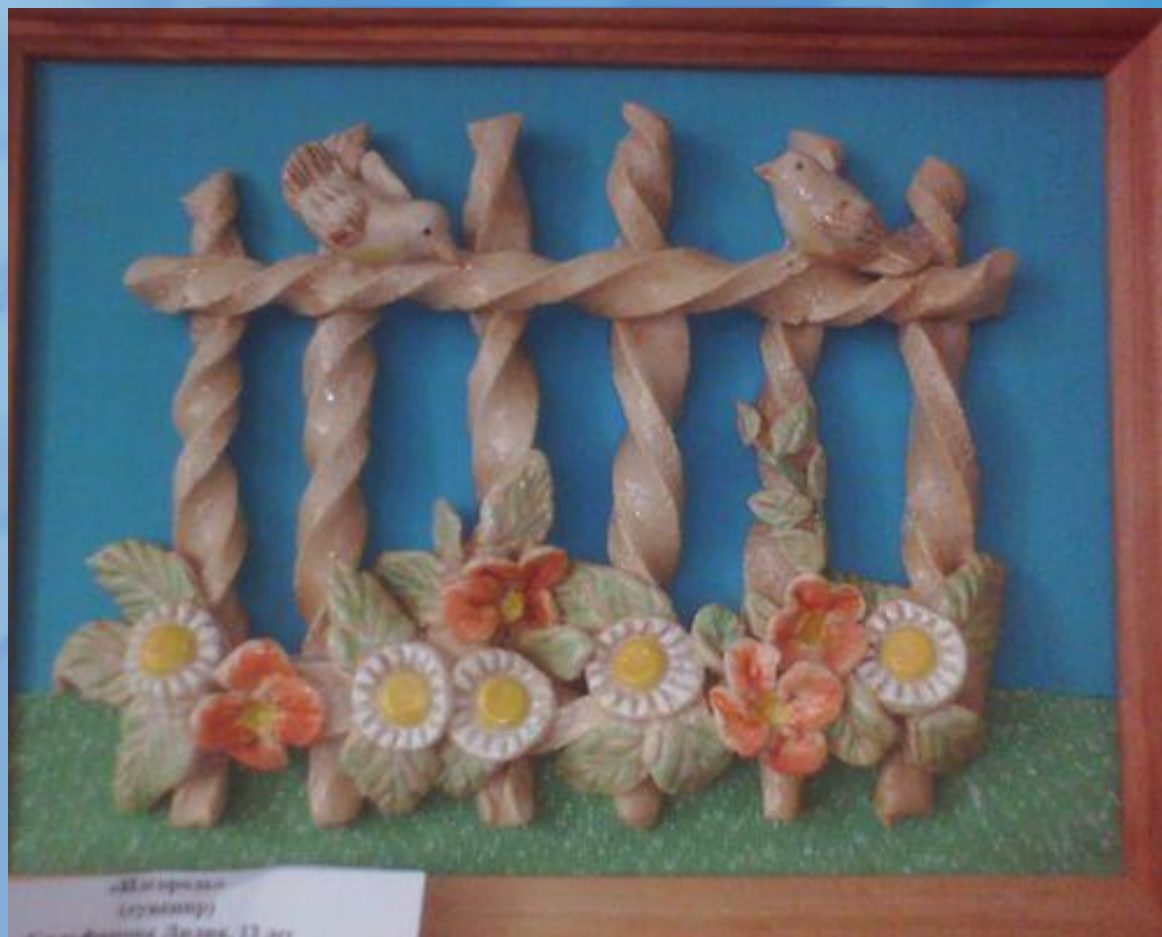
«Ветеран» (скульптура) С. С. Фомин, 20 лет, 11 лет