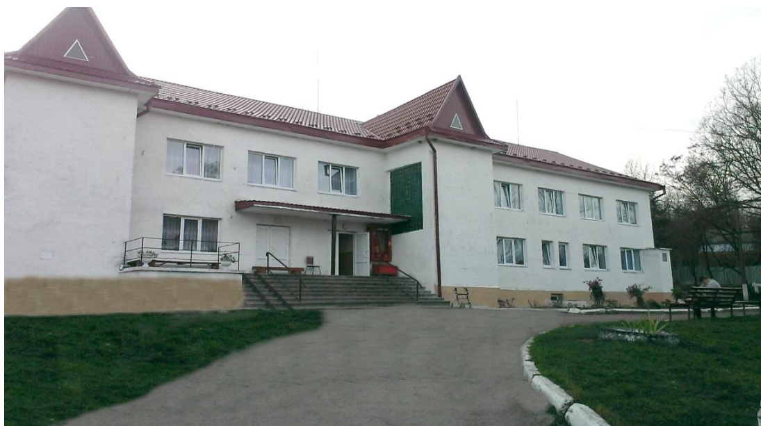
Центральний спальний корпус

До інтернату підведені всі комунікації, водопровід, каналізація, опалення. Територія інтернату займає більше 3,0га. та розділена вулицею Ковпака на дві частини: справа знаходиться адміністративний корпус та господарський двір; зліва - два спальні корпуси та допоміжні приміщення.