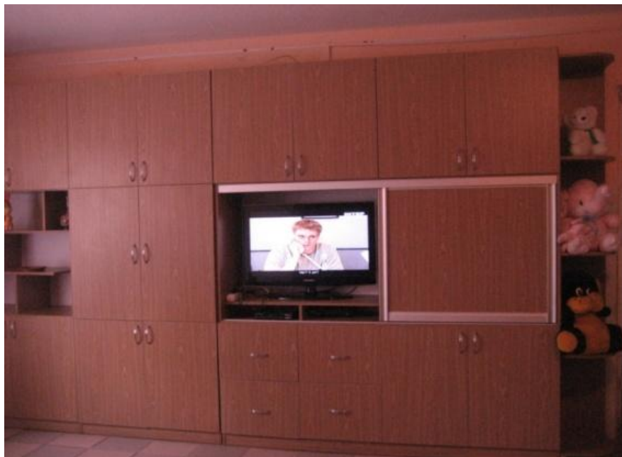
Вестибюль спального корпусу

Для покращення відпочинку підопічних в інтернаті облаштовано вестибюль з сучасним плазмовим телевізором та системою караоке та DVD, придбаних за допомогою шефської організації НГВУ “Надвірнанафтогаз”; встановлено нові меблі та м’які частини.