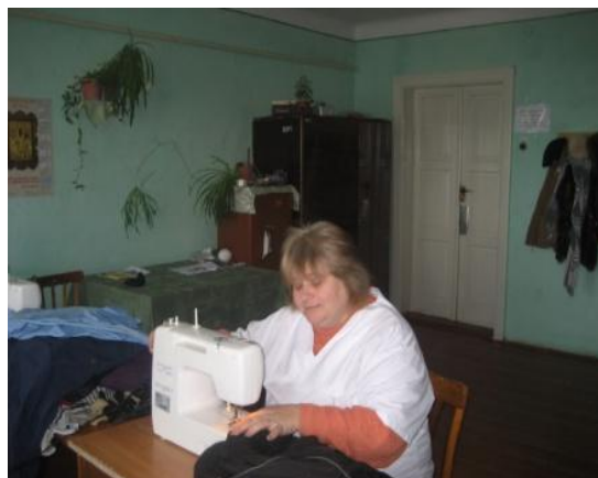
Інструктор з працетерапії