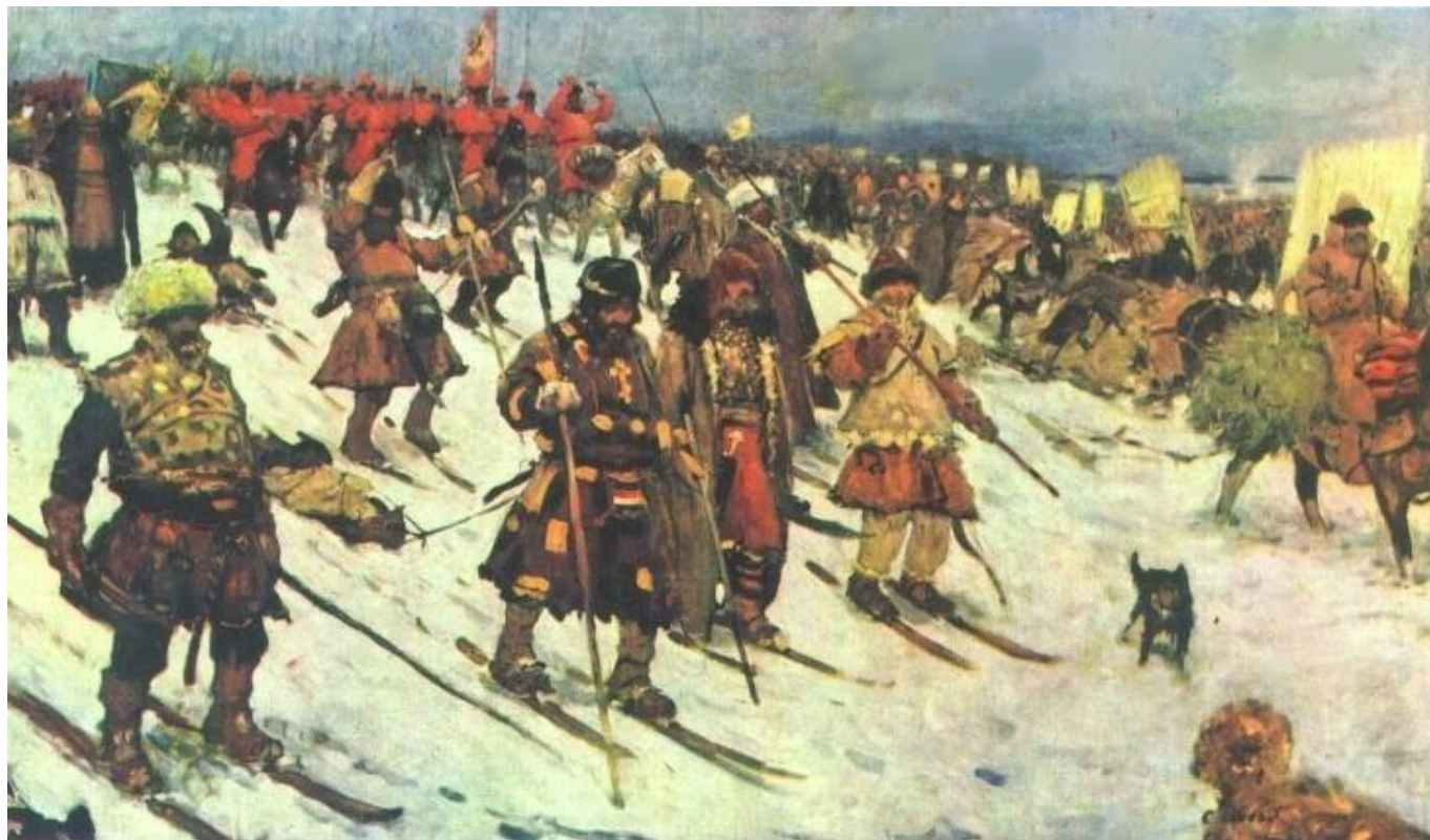
Поход московитян. 16 век